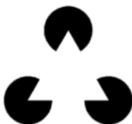
Figura 4. Il triangolo di Kanizsa .

Un esempio famoso di organizzazione percettiva secondo le “leggi della forma” è il triangolo di Kanizsa (Figura 4), “autentica icona, utilizzata per veicolare l’idea che la percezione visiva è, almeno in parte, un’attività creativa, in grado di sorprendere l’osservatore e di farlo riflettere sul rapporto tra apparenza e realtà” 5 . Si ha il costituirsi di un percetto (un triangolo che si stacca luminoso, al di sopra dei cerchi neri, anche se i suoi lati non sono tracciati) in assenza del corrispondente oggetto fisico (il triangolo tracciato vero e proprio).