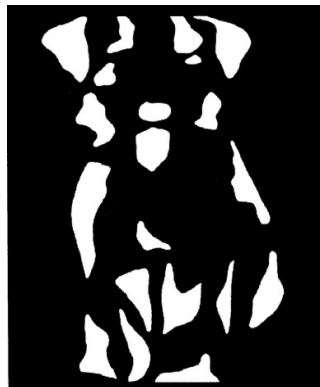
Figura 5. Si vede un cane.

può quindi influire sulle leggi di organizzazione strutturale, ma è in grado di imporre una data organizzazione rispetto ad altre 6 .