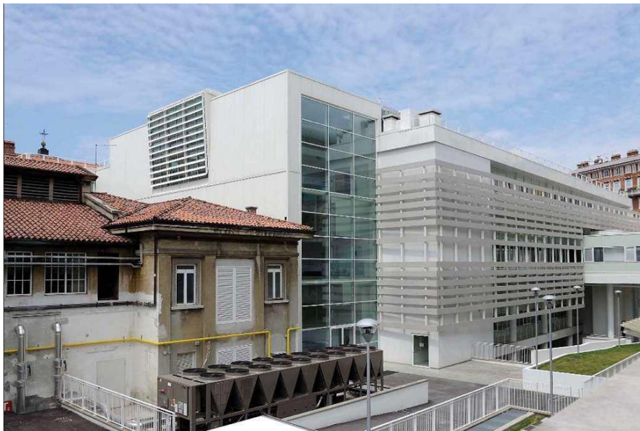
Figura 10. L'edificio che ospita la Clinica Oculistica presso l'Ospedale Maggiore di Trieste.

Per ciò che attiene all'Oftalmologia, le studentesse hanno potuto acquisire le conoscenze di base teoriche, scientifiche e professionali nel campo dell'ottica fisiopatologica, della clinica, della diagnostica e della terapia delle malattie dell'apparato visivo, sia in età pediatrica sia in età adulta.