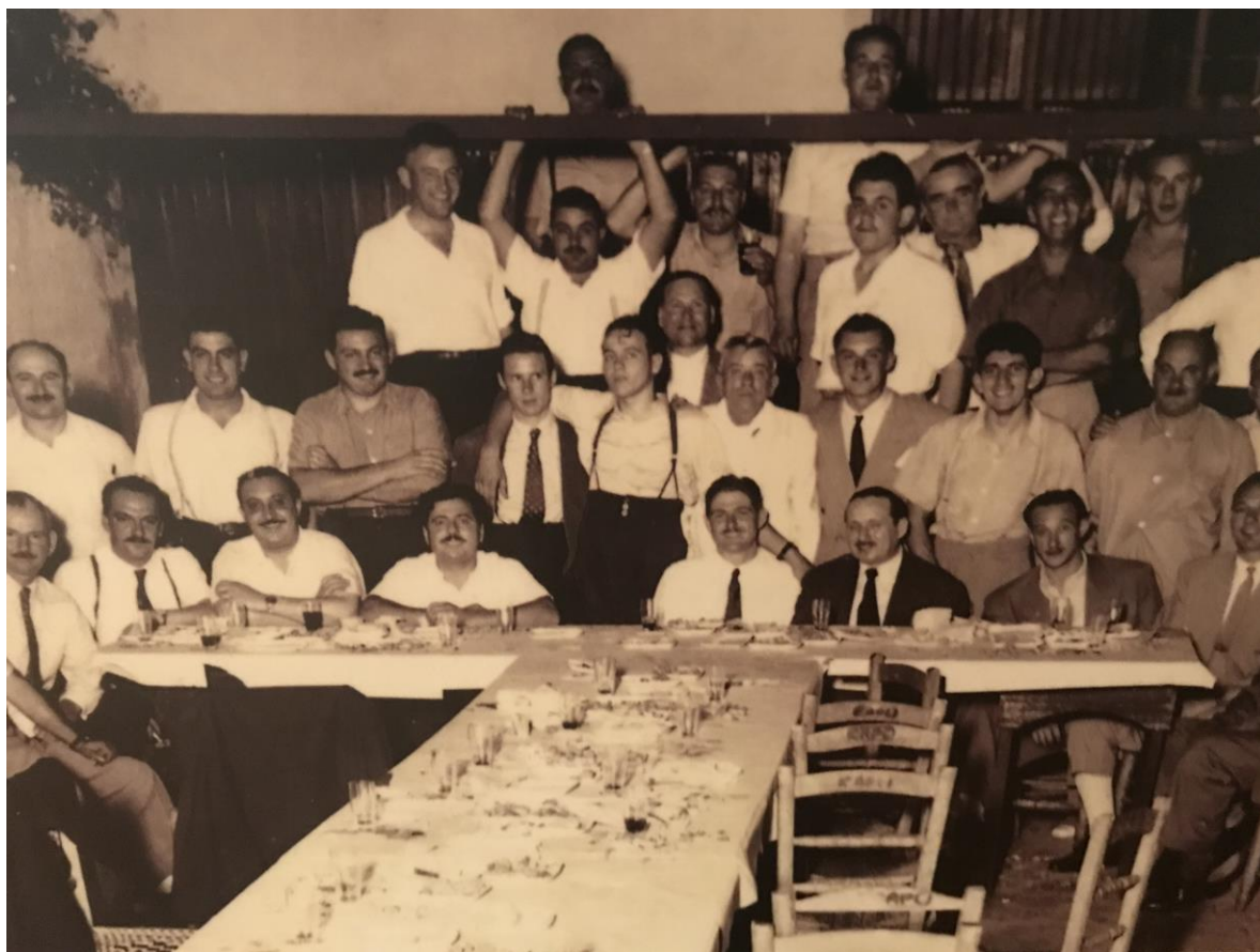
Figura 2. Conviviale di emigrati oriundi di Romans d'Isonzo del “Club Paraná”, scattata nell'anno 1932 c. a. (Fonte: Immagine tratta dalla mostra “in viaggio”, organizzata dalla SOMSI di Pordenone).

Inizialmente, gli emigrati di origine italiana si dedicarono a ciò che facevano in Patria, ossia la coltivazione della terra - e questo andava a pennello - vista la grande necessità di manodopera richiesta all'epoca dal settore agricolo.