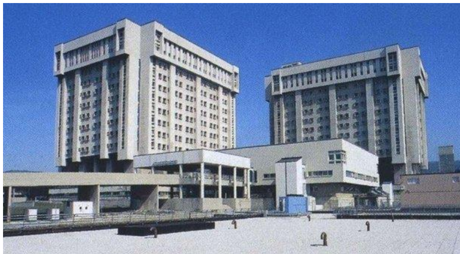
Figura 4. Gli edifici che ospitano l’Ospedale di Cattinara, a Trieste.

La Facoltà di Medicina e Chirurgia nasce, presso l’Università degli Studi di Trieste, nell’anno 1965, e confluisce poi, nel 2011, nel nuovo Dipartimento di Scienze Mediche, Chirurgiche e della Salute (DSMCS), svolgendo le funzioni relative alla ricerca scientifica e alle attività formative e assistenziali in diversi ambiti medico-scientifici.