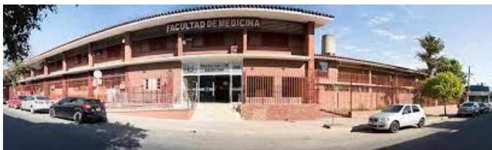
Figura 7. L'ingresso della Facoltà di Medicina dell'Università UNNE.

La Scuola di Medicina venne inaugurata il 27 aprile 1953 (associata, all'epoca, all'Universidad Nacional del Litoral) e l'attività accademica iniziò già il giorno seguente. Solo successivamente venne inglobata nell'Universidad Nacional del Nordeste 20 .