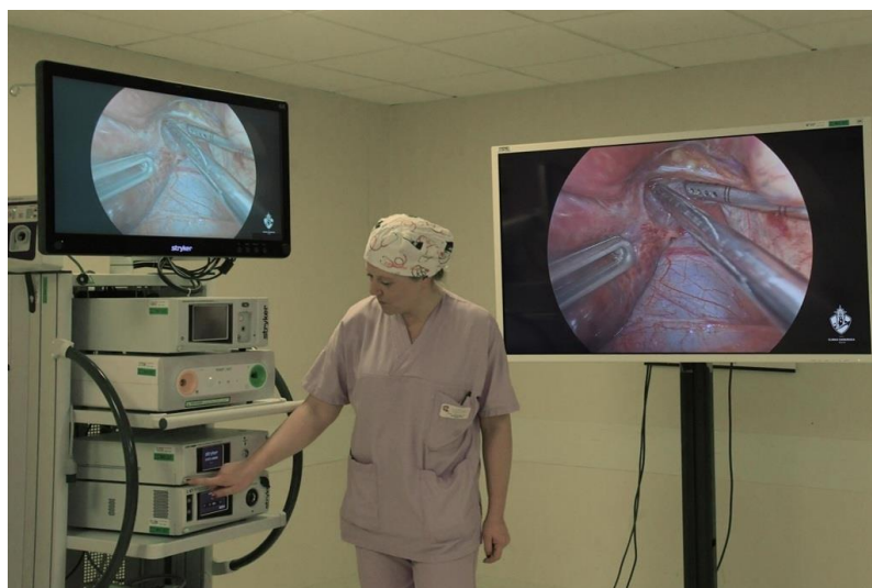
Figura 9. La strumentazione per sala operatoria, dotata di un nuovo sistema per chirurgia video assistita in realtà aumentata, utilizzata nella Clinica Chirurgica dell'Ospedale di Cattinara.

Nell'ambito del periodo di stage pratico sono state impartite le conoscenze di base riguardanti l'attività clinica, al fine di far acquisire le prime nozioni per una valutazione clinica complessiva delle malattie e dei pazienti sulla scorta delle conoscenze di patologia clinica, anatomia patologica, fisiopatologia chirurgica, metodologia clinica e diagnostica strumentale e per immagini.