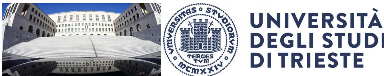
Figura 3. L'edificio centrale dell'Università degli studi di Trieste e il logo dell'Ateneo.

Il primo ospedale di Trieste risale al XII secolo (1141 c.a.) e venne edificato fuori dalle mura, esternamente alla “porta Cavana” nel luogo ove oggi si erge la villa Sartorio, con la denominazione “di Missier Santo Giusto”, così appellato forse perché nei pressi venne ritrovato, secoli prima, il corpo del martire tergestino San Giusto, patrono della città. Inoltre, fin dal Duecento, esisteva un ospedale per i poveri sull'altura di “Gatinara” (l'odierna Cattinara) 15 .