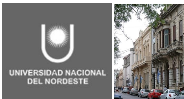
Figura 6. Il logo dell'Università UNNE e, a destra, il palazzo del Rettorato.

Conosciuta come l'Università del sole, UNNE è la settima università per numero di studenti in Argentina. È frequentata da circa 60.000 studenti e annovera 14 Facoltà (Architettura e Urbanistica, Lettere, Scienze Agrarie e Forestali, Agroindustria, Scienze Economiche, Scienze esatte, Giurisprudenza, Scienze Mediche, Scienze Naturali, Scienze veterinarie, Scienze Sociali, Scienze informatiche, Ingegneria e Odontoiatria). Dalla data della sua creazione ad oggi, l'Universidad Nacional del Nordeste (UNNE) ha come scopo fondamentale quello di soddisfare i bisogni culturali di istruzione superiore della regione nord-orientale del Paese.