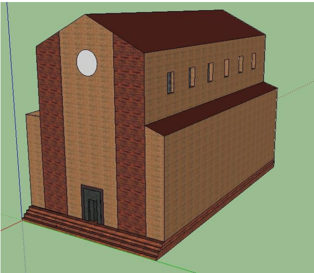
Fig. 2: La Collegiata in 3D -Sketchup