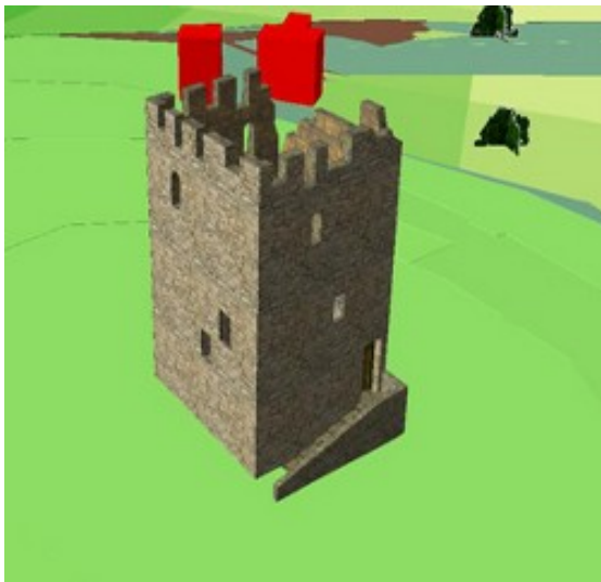
Fig. 2: La Torre Grossa in 3D