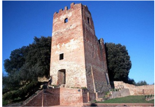
Fig.1: La Torre Grossa

La 'torre grossa', ancora visibile, sorge sul luogo del preesistente cassero del castello di Salamarzana.