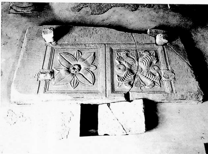
Fig. 1 - Concordia - Basilica Apostolorum: confessio sotto l'altare.