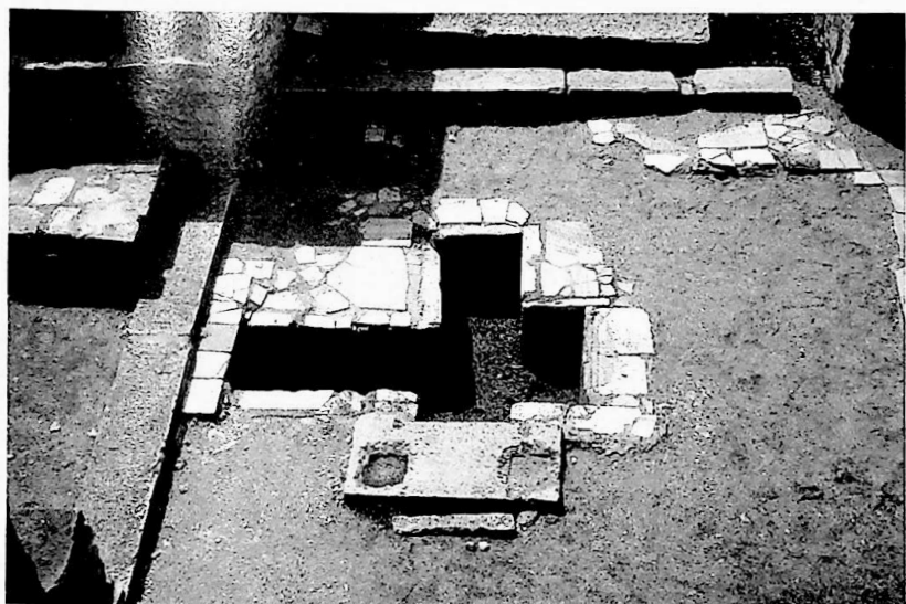
Fig. 2 - Concordia, Sepulcretum a forma di croce nella Trichora.