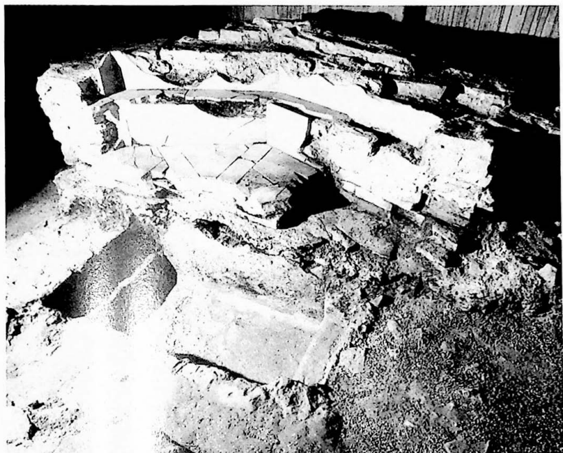
Fig. 4 - Aquileia, cripta degli scavi: resti del fonte battesimale della Post-teodoriana nord in cui fu battezzato Rufino.