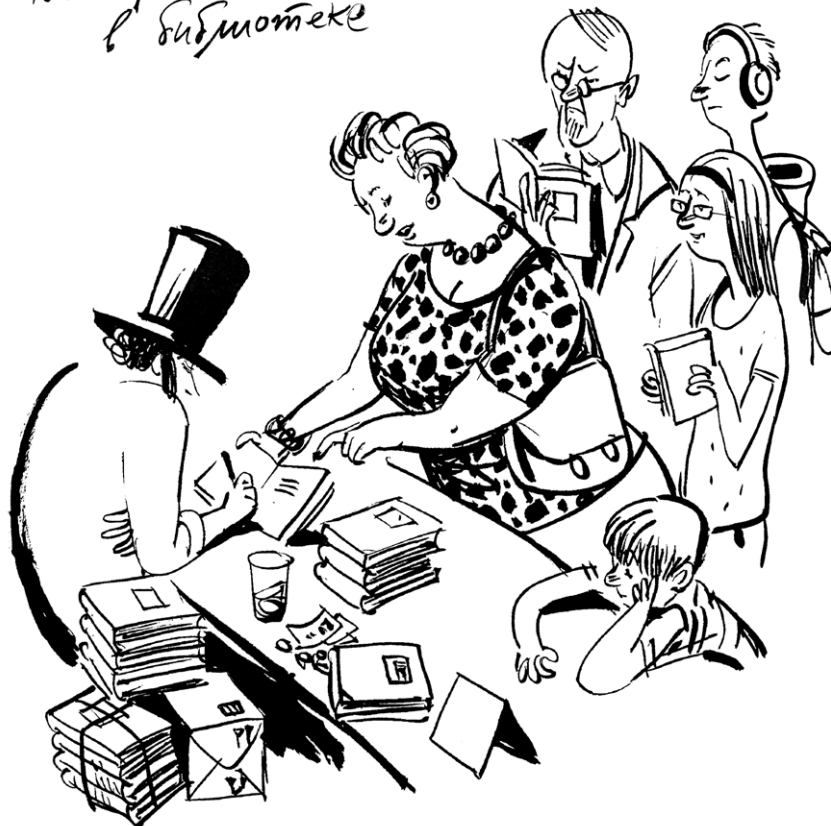
← FIG. 2 Puškin fa il firmacopie del suo ultimo libro (Dvoskina 2021: 144). 39

Пушкин подписывает книги на встрече с читателями в библиотеке