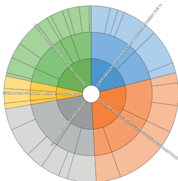
Slika 5: Primerjava (glavne teme) po številu kodirnih referenc (v angleškem jeziku)

Slika 5 ponazarja število kod / referenc, ki se nanašajo na določeno temo.