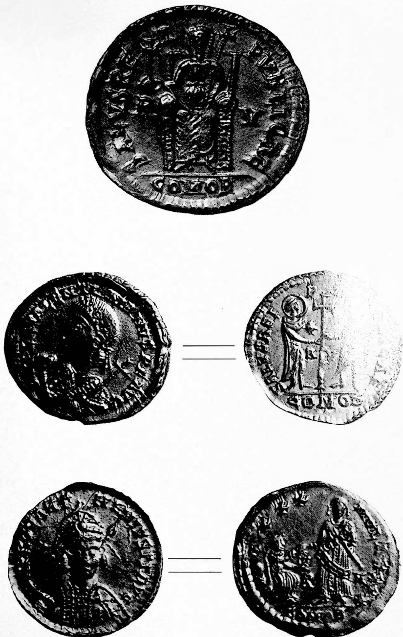
Tav. II - Tipi monetali della Zecca di Ravenna.