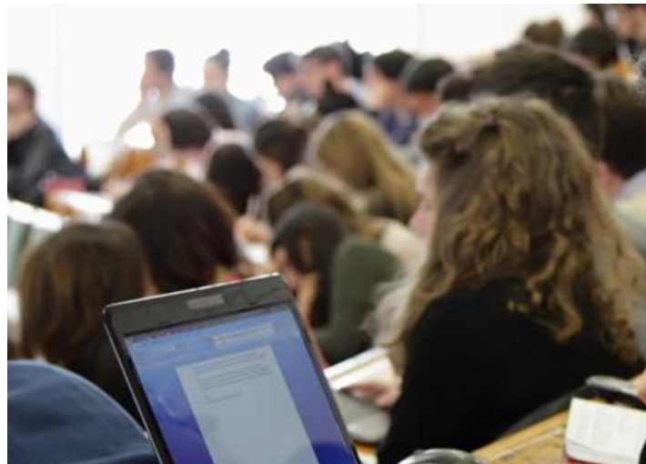
Figura 1. Il Progetto Moduli Formativi dell'Università di Trieste.

Infine, nella prospettiva di sviluppo, va considerato che per sostenere l'azione di orientamento, i Dipartimenti, i docenti, i Consigli di classe, con l'apporto di figure provenienti dal mondo universitario, possono organizzare attività che mettano in grado lo studente, a conclusione del percorso quinquennale, di sperimentare diversi sviluppi personali: