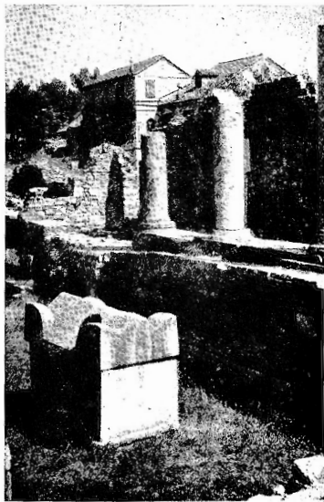
SALONA : Minima parte dei resti grandiosi. La basilica cristiana in località Menestrine.