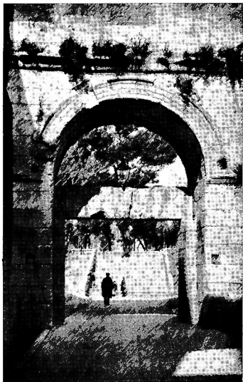
SPALATO : Palazzo di Diocleziano. La Porta aurea vista dall'interno.