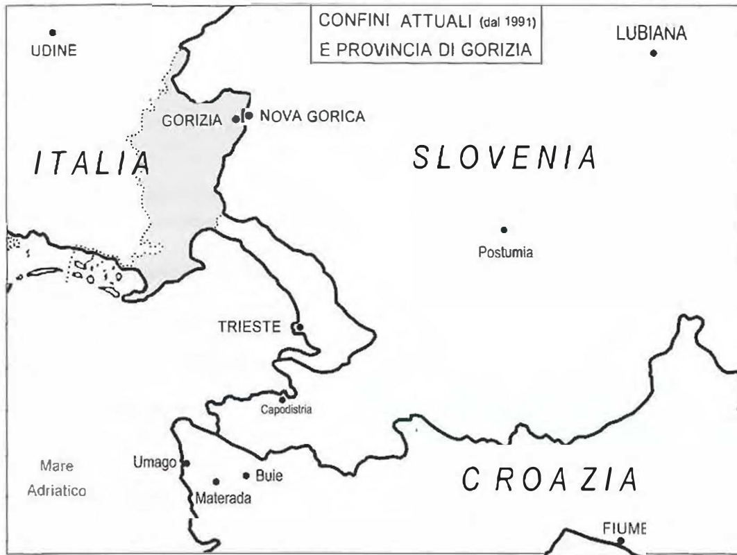
Fig. n. 6: confini attuali (dal 1991) e provincia di Gorizia (cartina di F. Cecotti)