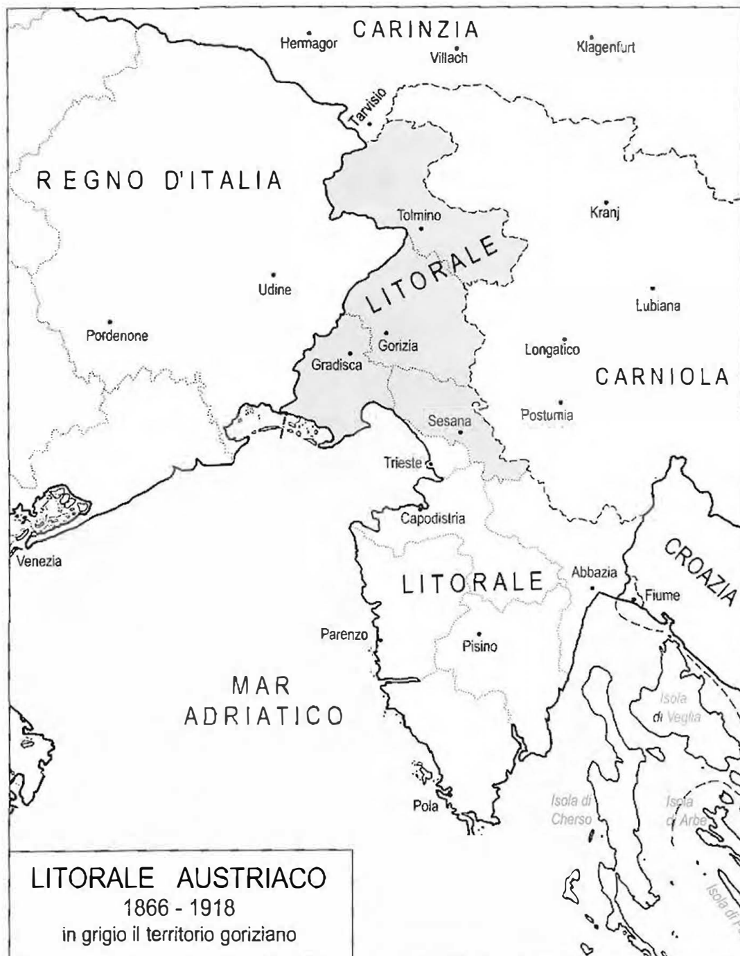
Fig. 2: la Provincia del Litorale austriaco, 1866-1918