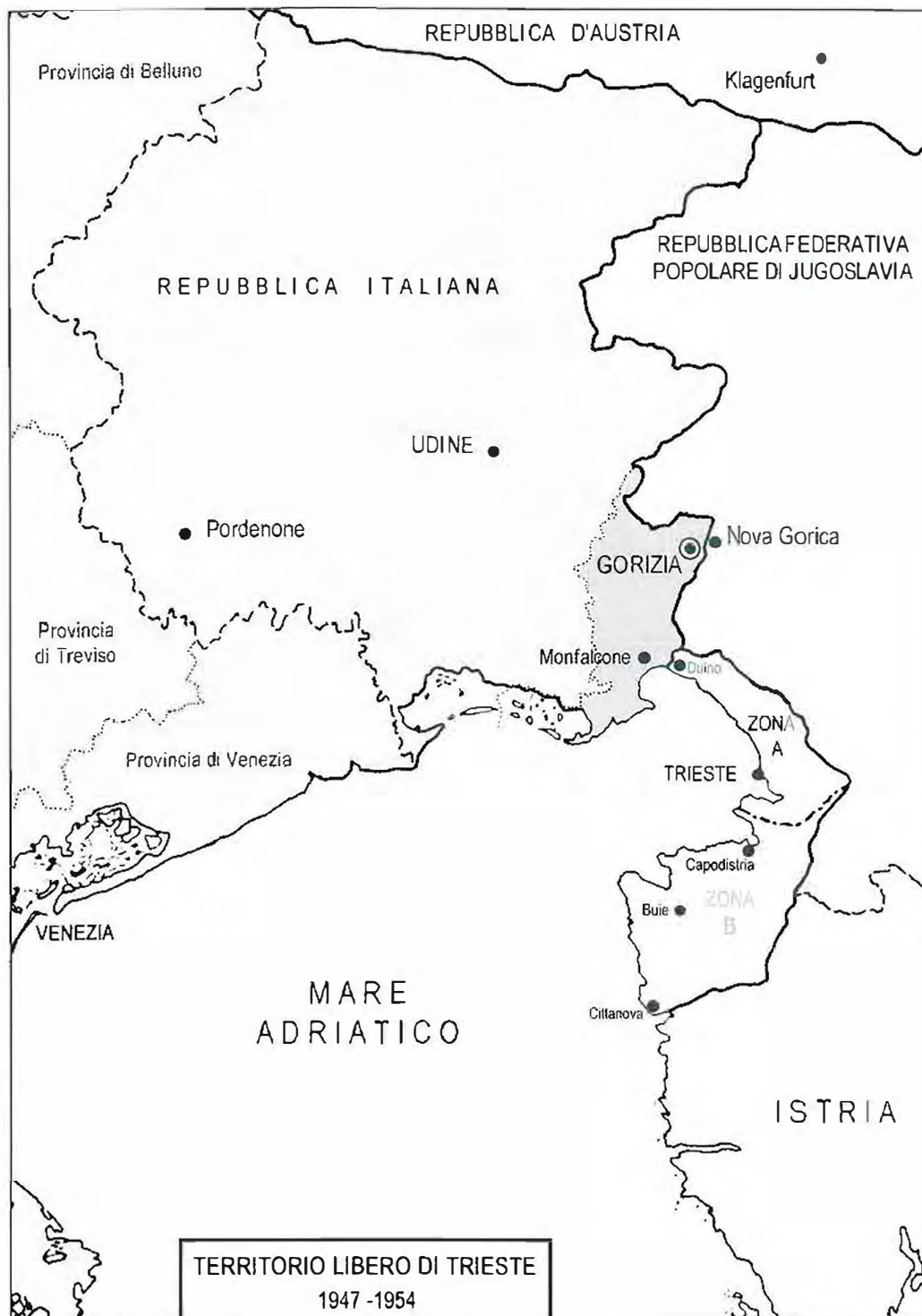
Fig. n. 5: il Territorio libero di Trieste 1947-1954