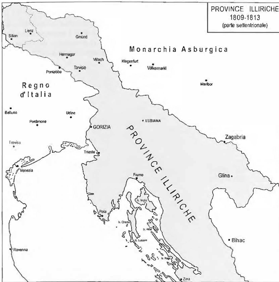
Fig. 1: il Regno delle Provincie Illiriche, 1809-1813, parte settentrionale