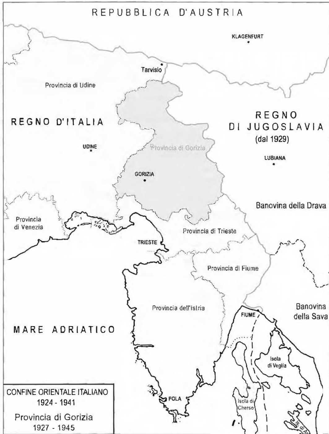
Fig. n. 4: il confine orientale italiano, 1924-1941; la Provincia di Gorizia, 1927-1945