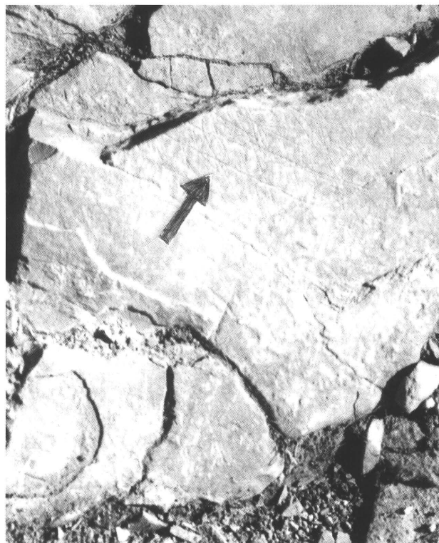
Fig. 4. Roccia con incisioni a tecnica lineare.

zione di roccia intermedia fra 2 e 4 la presenza di una serie di linee incise assai sottilmente, che non sembrano dovute alla sfregamento casuale di sassi o altro. Sono riunite per gruppi con andamento diverso e fanno pensare ad incisioni a tecnica lineare forse di tipo alberiforme (fig. 4).