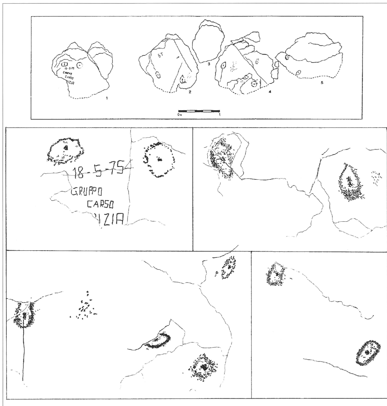
Tav. I. Faedis (Udine). Planimetria delle rocce incise e rilievo delle rocce 1, 2, 4, 5.