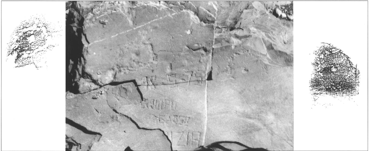
Fig. 1. Fotografia e frottages delle incisioni 1a, 1b.