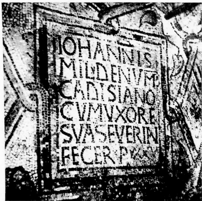
Fig. 2. GRADO, Basilica di S. Eufemia - Iscrizione votiva di Iohannis miles del numerus Cadisianus.