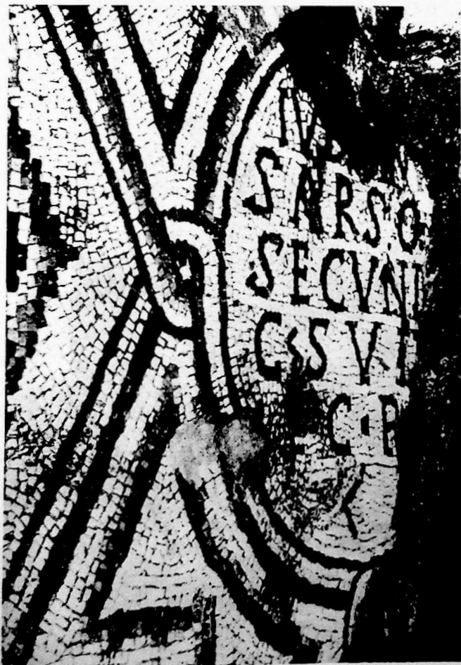
Fig. 3. TRIESTE - Basilica martiriale di via Madonna del Mare - Iscrizione votiva di Iubianus sarsor (da Cuscito).