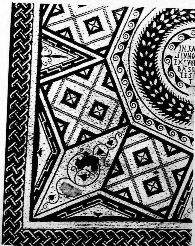
Fig. 6. Ibidem. - Iscrizione votiva di Infantius et Innocentia prima dei restauri (da Degrassi).