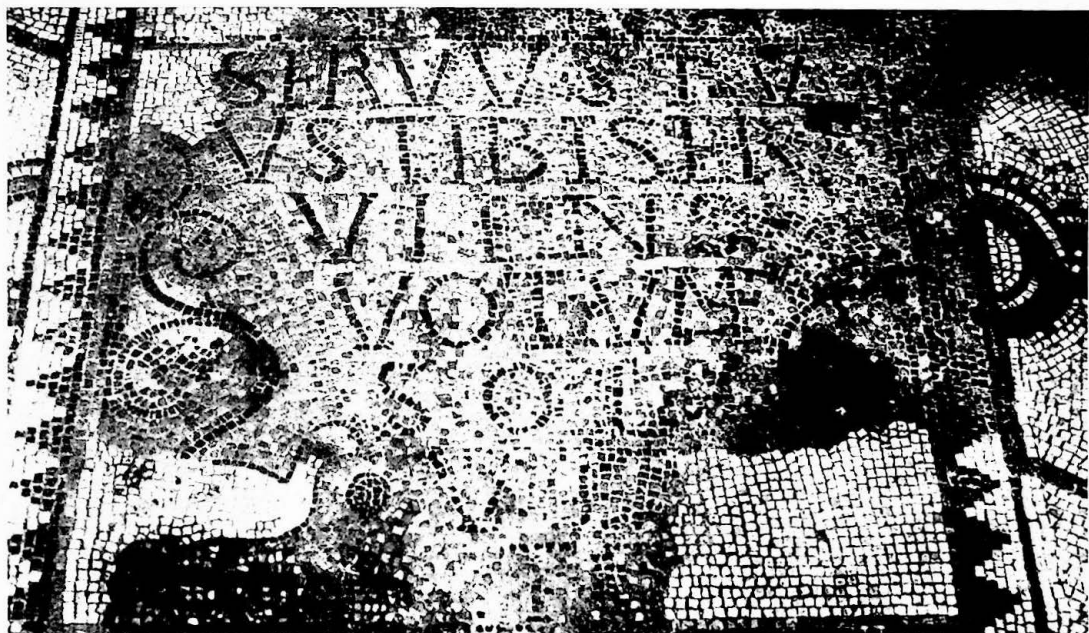
Fig. 4a. GRADO, Basilica di S. Eufemia - Iscrizione di Domninus v(ir) c(larissimus).