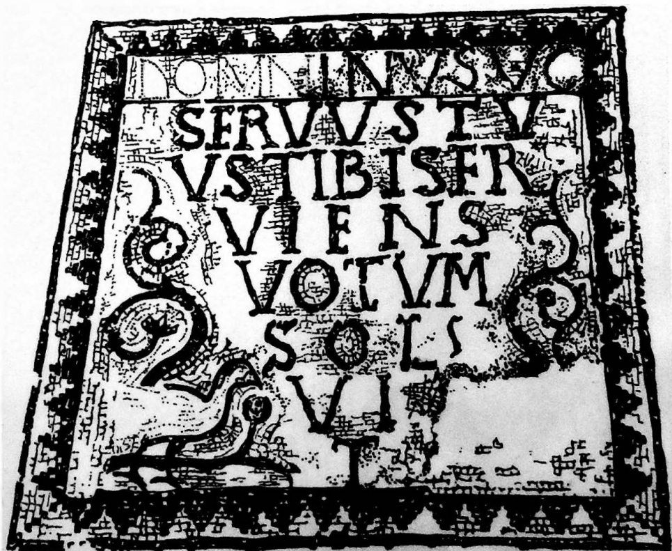
Fig. 4b. Ibidem, Apografo della precedente iscrizione con evidenziata la prima riga in parte non più visibile (dis. A. Acconci).