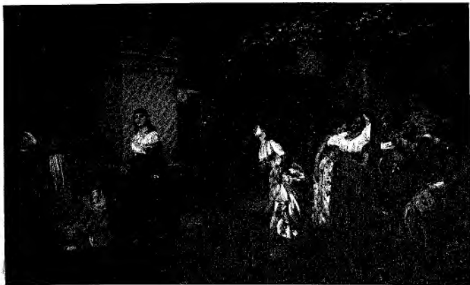
MADAME ROLAND A S.TA PELAGIA.

Quadro di E. Carpentier. -- Civico Museo Revoltella.