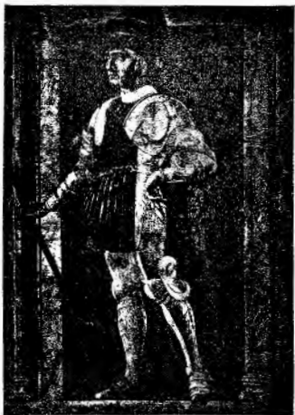
FARINATA DEGLI UBERTI

Non voglio dire con ciò che le illustrazioni si debbano del tutto bandire. No certo: ma converrà usarle con altri intendimenti. In quanto un'illustrazione e, meglio, tutta una serie di illustrazioni, tutta un'opera illustrata dalla stessa penna, possa render un modo individuale di concepire l'autore, possa rappresentare quasi un commento soggettivo, una interpretazione personale di un'opera letteraria, e in quanto sempre cotali illustrazioni abbiano valore artistico, quasi sieno una nuova creazione, una metempsicosi (come vorrebbe per le traduzioni il Villamovitz) di un'idea da un'arte all'altra, in quanto sieno piuttosto considerate come opere d'arte che stieno da sè, e non sieno tratte a lumeggiare un'opera d'arte sorella, ma vivano di vita propria accanto a lei, in quanto ciò avvenga, le illustrazioni saranno certo le ben venute e le accoglierà molto volentieri anche l'insegnamento dell'italiano. I disegni di Sandro Botticelli alla Divina Commedia non sono essi altrettanti capolavori? non rivelano l'atteggiamento di un'anima (di quale anima!) dinanzi al poema dantesco? Le illustrazioni che egli ci dà dei canti del Paradiso terrestre nella loro vaghezza e soavità di concezione, nella semplicità e schiettezza del disegno, nella grazia degli atteggiamenti, nella vivezza della vegetazione possono lasciar desiderare alcunchè di più dantesco? Chi non getta volentieri da