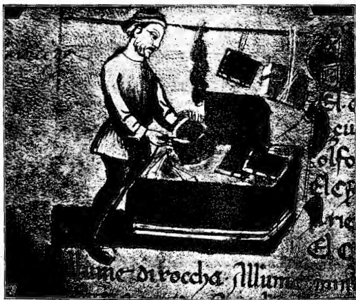
SPEZIALE FIORENTINO. (Da un codice della «Riccardiana»).

Il ritratto che dell'Ariosto fece il Tiziano non „ritiene“ forse „Nell'ampia fronte e nel fiso occhio e tardo | Lo stupor dei gran sogni?“ e l'acquerello che riproduce la Villa Ferrigni col Vesuvio e l'odorata ginestra (V. Percopo-Wiese) e tutta la bella serie di riproduzioni di Codici danteschi che dà il Bassermann, e gli autografi dell'Ariosto pubblicati dall'Agnelli, non sono documenti storici parlanti, umani, psicologici, da servire all'insegnamento della storia letteraria anche nelle scuole medie? E