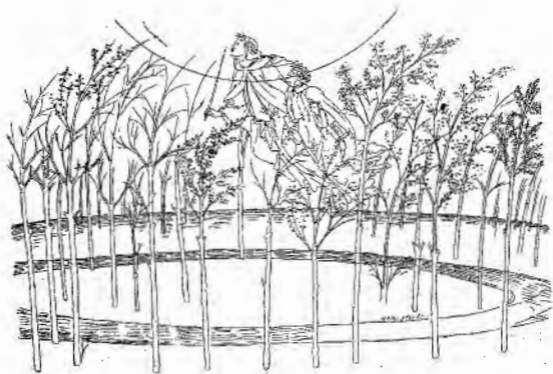
Botticelli, disegno a penna — al Par., I.

sè le visioni che egli s'era formato di quella foresta e di quel corteo per porvi le fantasie di Sandro? E si badi che è un getto codesto che si fa molto a malincuore: quando uno s'è foggiato un'immagine d'un paesaggio o d'una scena qualunque non la discaccia così facilmente: solo dinanzi alla verità vera o alla verità intuita si cede: solo quando io mi fossi immaginato la pineta di Chiassi in un modo e poi la vedessi in realtà diversa, o solo dinanzi a una visione d'arte che mi desse l'intuito della verità, della massima corrispondenza coll'immagine del poeta, io