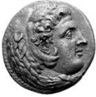
Planche 5 1:1