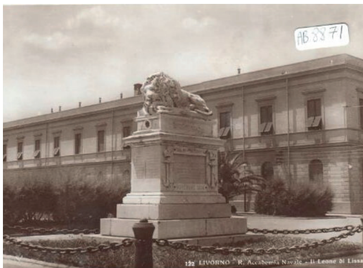
Fig. Leone di Lissa, traslato sul Viale dei pini presso la Regia Accademia Navale.

la comunicazione tra culture diverse, richiamata dal Professor Crismani, evidenzio che non molto lontano da Trieste, di fronte alle sponde dalmate, c'è l'isola di Lissa, teatro nel 1866 della famosa battaglia navale tra l'impero Austro-Ungarico e l'Italia, combattuta durante la terza guerra d'indipendenza. Su un promontorio, sede di convento e cimitero di marinai, era stato posto il monumento del 'Leone morente di Lissa' 2 che ricorda questa battaglia, sul quale è impressa la frase "Se metti un dito nel mare entri in contatto con il mondo".