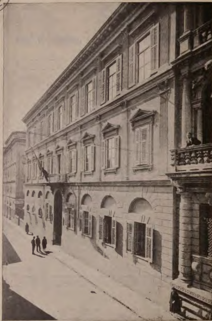
PALAZZO DEGLI STUDI (Via dell'Università, 7)