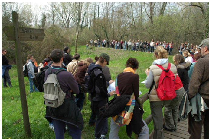
Visita al Parco delle risorgive di Codroipo (UD) nell’ambito del Progetto strategico “Giovani Docenti”.