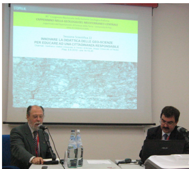
I lavori della sessione scientifica dedicata alla didattica delle geoscienze nell'ambito dell'85° Congresso della Società Geologica Italiana (Pisa, 8.9.2010).

Le attività di ricerca si sono ulteriormente snodate, affrontando questioni riferibili agli ambiti della didattica dell'educazione ambientale nelle Scuole di ogni ordine e grado, con particolare riferimento alle connessioni con le cogenti tematiche inerenti la cittadinanza attiva responsabile, l'educazione alla sicurezza e la didattica laboratoriale (a. a. 2008-09) nonché della didattica delle geoscienze, con particolare riguardo alle connessioni sinergiche interdisciplinari e alla progettazione di curricula interdisciplinari sinergici verticali (a. a. 2009-10).