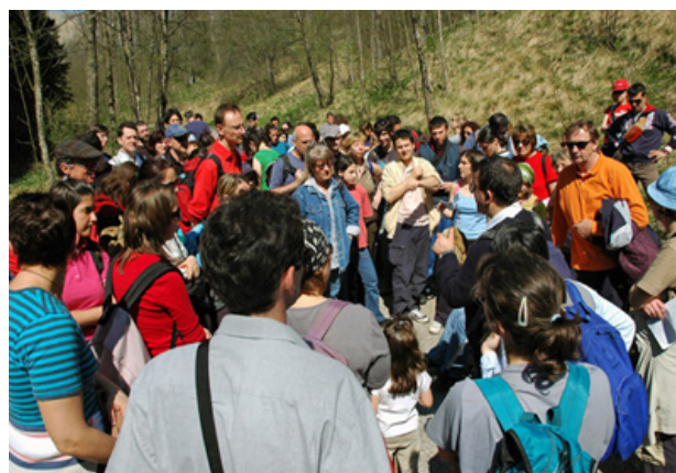
Attività di formazione nell'ambito del Progetto strategico "Giovani Docenti".

Ci si limita a segnalare in questa sede le iniziative che hanno ottenuto il riconoscimento ministeriale: