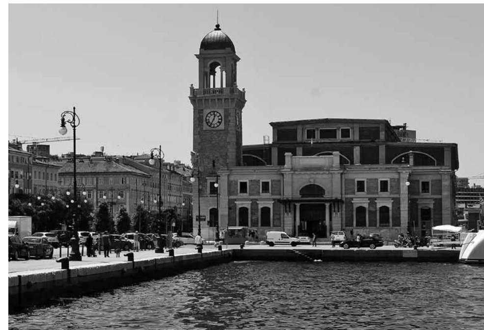
5 - GIORGIO POLLI, La Pescheria Centrale di Trieste

All'esterno (fig. 5) invece le strutture portanti, che all'interno sono a vista, vengono completamente rivestite. L'impiego, secondo tradizione, del mattone nelle pareti (con un gioco decorativo di minime rientranze ed emergenze) e dei risalti in pietra bianca, nonché le decorazioni di carattere marinaro, conferiscono all'edificio una 'patina' veneziana già suggerita dalla sua collocazione tra i moli della darsena. E poi il ricorso ad alcuni strumenti di connotazio-