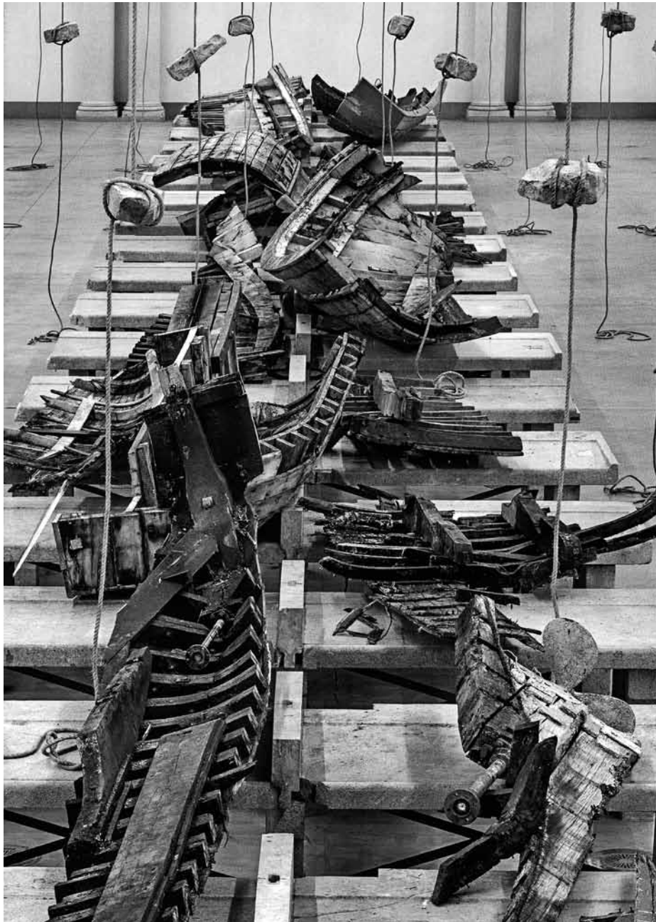
6 - Installazione Kounellis, relitti di imbarcazioni