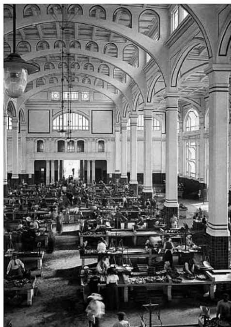
4 - GIORGIO POLLI, Pescheria Centrale: l'interno, 1913 , fotografia storica. Trieste, Fototeca dei Civici Musei di Storia e Arte

Il contemperamento delle diverse esigenze sembrò potersi compiere attraverso il modello basilicale, che si riconvertiva così alla sua profana funzione originaria di mercato. Le tre ampie navate consentivano tutto ciò che esigeva un esercizio commerciale di notevoli dimensioni, mentre le strutture in cemento armato permettevano di alleggerire i muri perimetrali e di interromperli con grandi finestroni. Le stesse articolazioni dell'edificio acquisivano una specifica funzione: il pronao era destinato a ospitare le aste del pesce, mentre il campanile mascherava il serbatoio dell'acqua marina che doveva essere alzata per servire ai banchi di vendita.