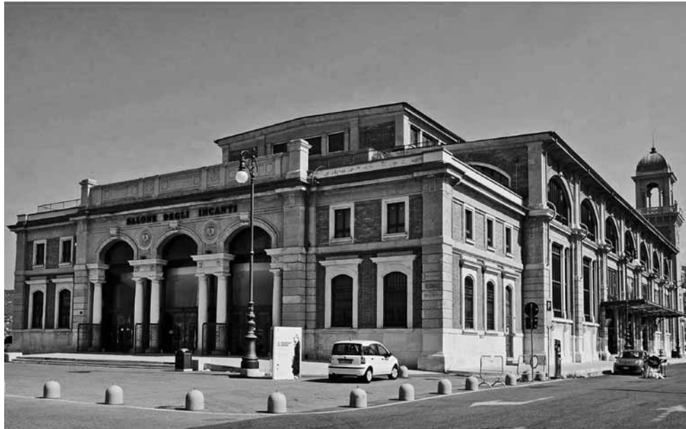
1 - Trieste, Salone degli Incanti, già Pescheria Centrale

Pace, ai progetti di architettura, alle scatole di Warhol, all'attività dell'“Immaginario scientifico” (che si è proposto per il suo uso continuativo) con giocosi laboratori scientifici per bambini. Oggi si parla anche di destinarlo ad una mostra del caffè organizzata dalla “Illy”. Tutte iniziative, dunque, che non sono riuscite a prospettare una definitiva destinazione dell'edificio, anche in rapporto alle sue specifiche caratteristiche di spazio, ariosità, luminosità. Un luogo di esposizione che resta perciò aperto a varie proposte temporanee: nulla di permanente, anche nel migliore dei casi. A somiglianza, mi verrebbe da dire, della Turbine Hall della Tate Modern di Londra, dove per un lungo periodo lo spazio enorme della ex-Sala delle turbine viene consegnato ad un artista