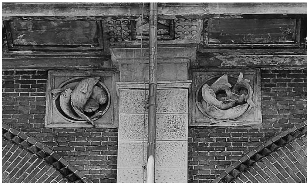
2 - GIORGIO POLLI, Pescheria Centrale : tessitura muraria in mattone, risalti in pietra bianca d'Istria e decorazioni marine

co della sistemazione dell'isolato Chiozza, sostituendo la Casa neoclassica del Mollari (1802) con altra di scala ben maggiore, dopo il radicale sventramento del sito, dovuto alle esigenze di sviluppo del sistema viario cittadino. L'impegno progettuale, iniziato nel 1914 ma interrotto dalla guerra, si realizzerà tra il 1924 e il 1927 con l'imponente Palazzo dei Portici di Chiozza. È un edificio che riprende lo schema neoclassico della casa Chiozza, ma ne dilata la griglia in larghezza e lunghezza, come in un ingrandimento fotografico che mantiene i rapporti tra i piani e l'incolonnatura delle finestre ingabbiate dagli ordini. I piani, compresi i due mezzanini e l'attico, sono sette, limite massimo per rispettare lo schema base dell'architettura palaziale rinascimentale.