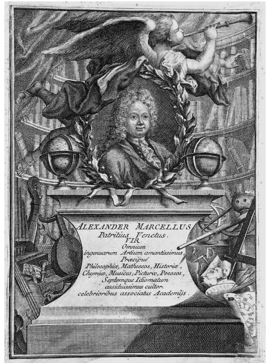
2 - Composizione con il ritratto di Alessandro Marcello , incisione