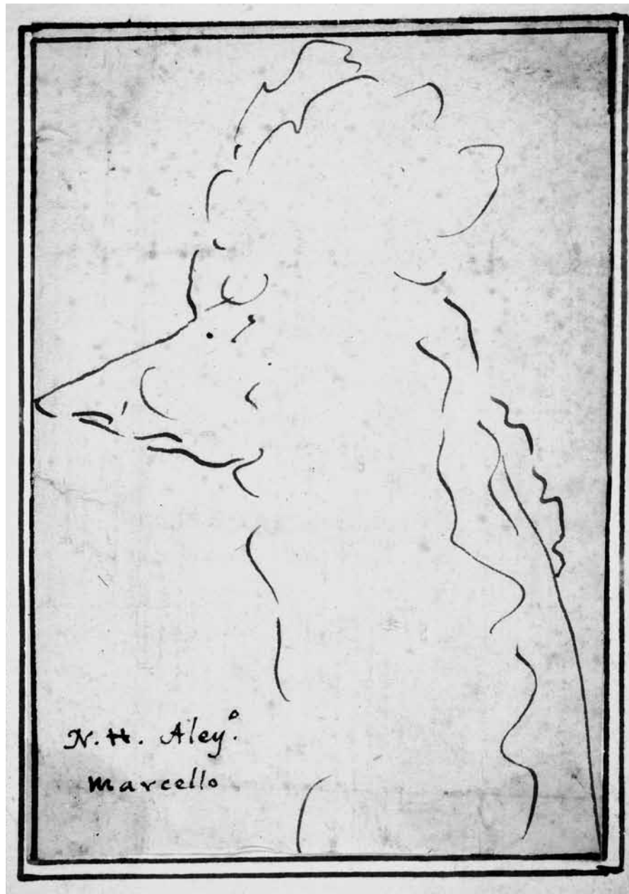
1 - ANTON MARIA ZANETTI, Caricatura di Alessandro Marcello . Venezia, Fondazione Giorgio Cini