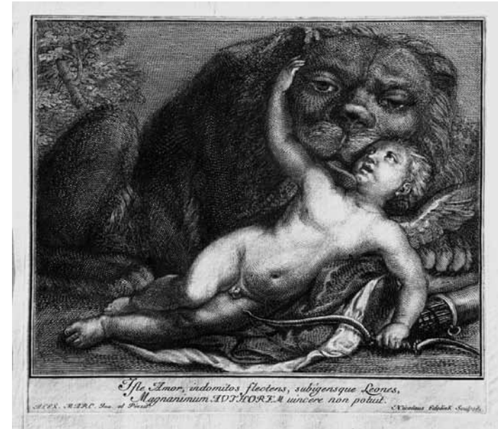
9 - ALESSANDRO MARCELLO, Cupido con un leone , incisione di NICOLAS-ETIENNE EDELINCK