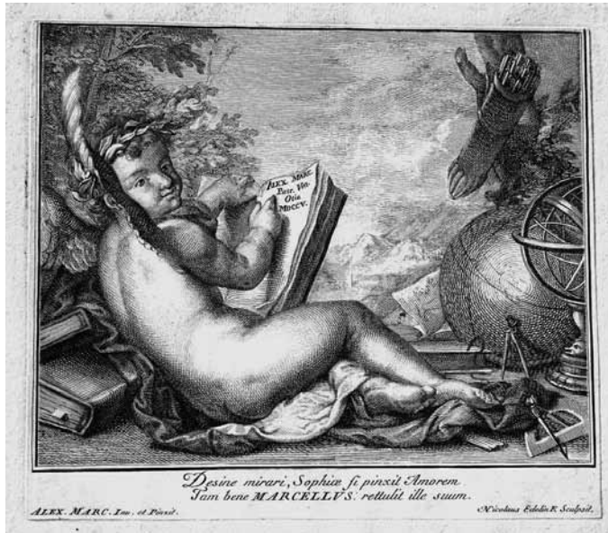
6 - ALESSANDRO MARCELLO, Cupido con libri e strumenti scientifici , incisione di NICOLAS-ETIENNE EDELINCK