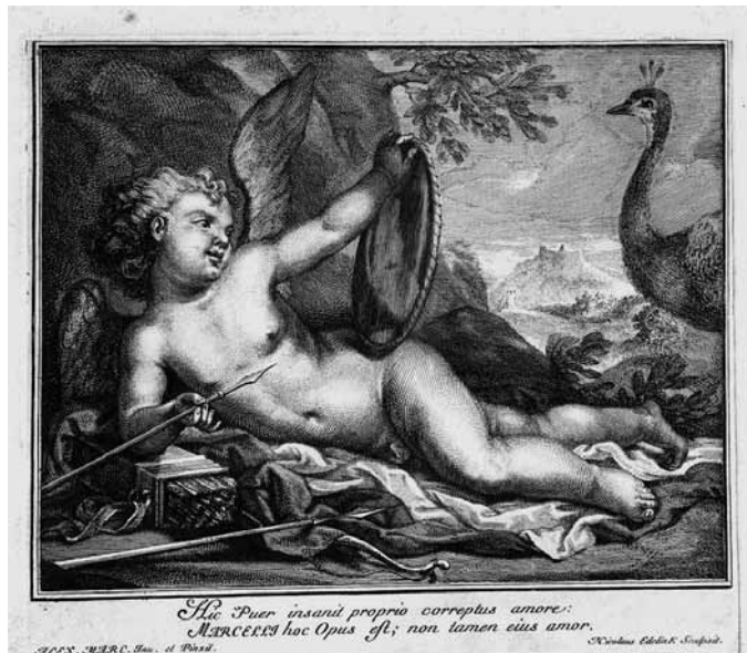
7 - ALESSANDRO MARCELLO, Cupido con freccia e specchio , incisione di NICOLAS-ETIENNE EDELINCK