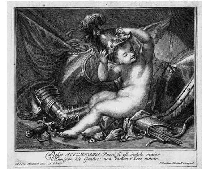
8 - ALESSANDRO MARCELLO, Cupido con un'armatura , incisione di NICOLAS-ETIENNE EDELINCK