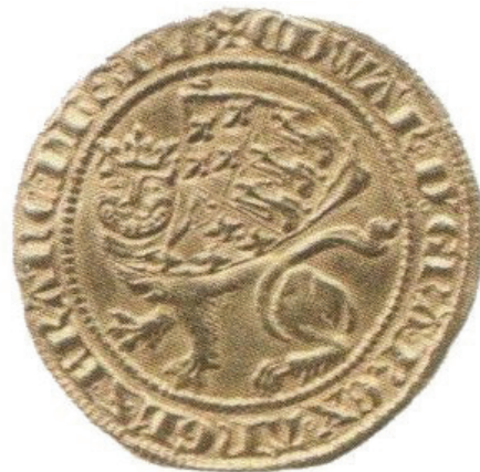
Fig. 3 – Leopard, oro, Edoardo III (1327-1377), 1344, dritto.

volta in diretto riferimento al conflitto in corso. Risulta curiosa l'espressione del leopardo, la quale sembra mostrare i denti in segno di sfida o di beffe nei confronti di un ipotetico interlocutore. La legenda circolare è la medesima di quella riportata sul double leopard , EDWAR·D·GRA·REX·A NGL·Z·FRANC·DNS·HIB (fig. 3). Il rovescio non mostra differenze sostanziali rispetto a quanto descritto per il doppio leopardo. A differire è la legenda circolare che presenta l'iscrizione DOMINE·IN·FVRORE·TVO·ARGVAS·ME. Il passo è tratto dal Libro dei Salmi: «Signore, nella tua ira non mi riprendere», presente in due salmi, il 6, al versetto 2 e il 37, ancora al versetto 2 20 . Il continuo rimando al Libro Sacro può forse essere spiegato con l'immagine di «monarca rigidamente cristiano» che Edoardo III desiderava trasmettere all'esterno 21 .