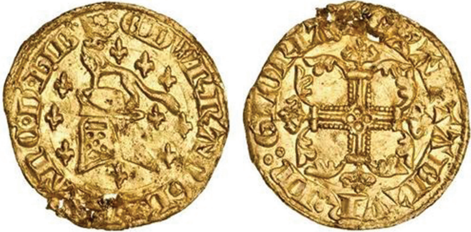
Fig. 4 – Helm, oro, Edoardo III (1327-1377), 1344. Immagine non in scala.

La moneta d'oro del peso equivalente a \frac{1}{2} fiorino (g. 1,75 circa) venne chiamata helm . Al dritto è riportata l'immagine di un elmo visto di profilo, sormontato da un piccolo leopardo coronato e con la testa frontale. Il campo della moneta è cosparso di gigli. La legenda circolare presenta l'iscrizione abbreviata EDWR·R·ANGL·Z·FRANC·D·HIB. Al rovescio è presente la croce foliata e coronata, con legenda circolare EXALTABITVR IN GLORIA (fig. 4). Nuovamente l'espressione è tratta dal Libro dei Salmi, nello specifico il Salmo 111, versetto 9: «S'eleverà in gloria la sua potenza» 22 .