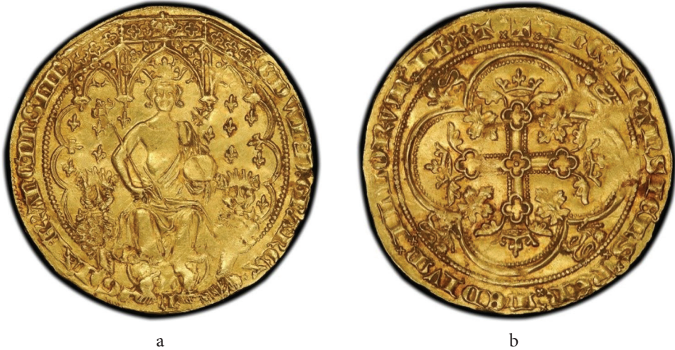
Fig. 1 – Double leopard, oro, Edoardo III (1327-1377), 1344. – a. Dritto / b. Rovescio. Immagini non in scala.