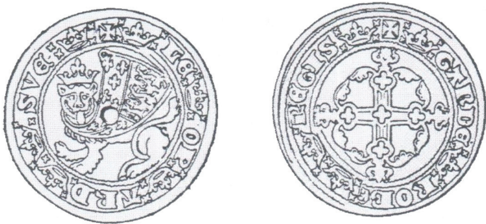
Fig. 6 – Moneta campione, bronzo (g. 10,75), Edoardo III (1327-1377). Immagine non in scala.