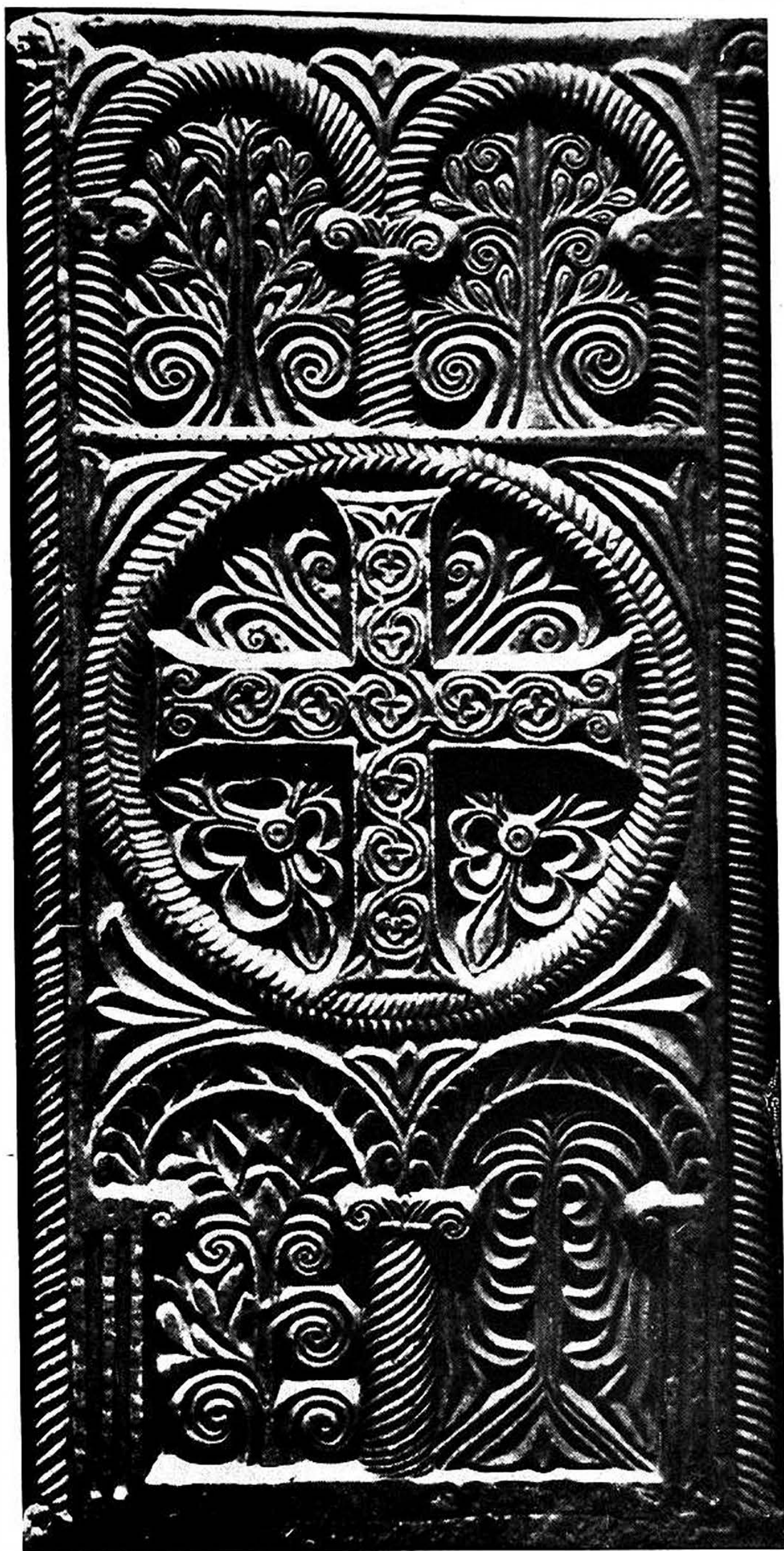
Fig. 3 - Sesto al Reghena. Cripta della chiesa abbatiale. « Urna » di S. Anastasia, coperchio, c. metà VIII sec.