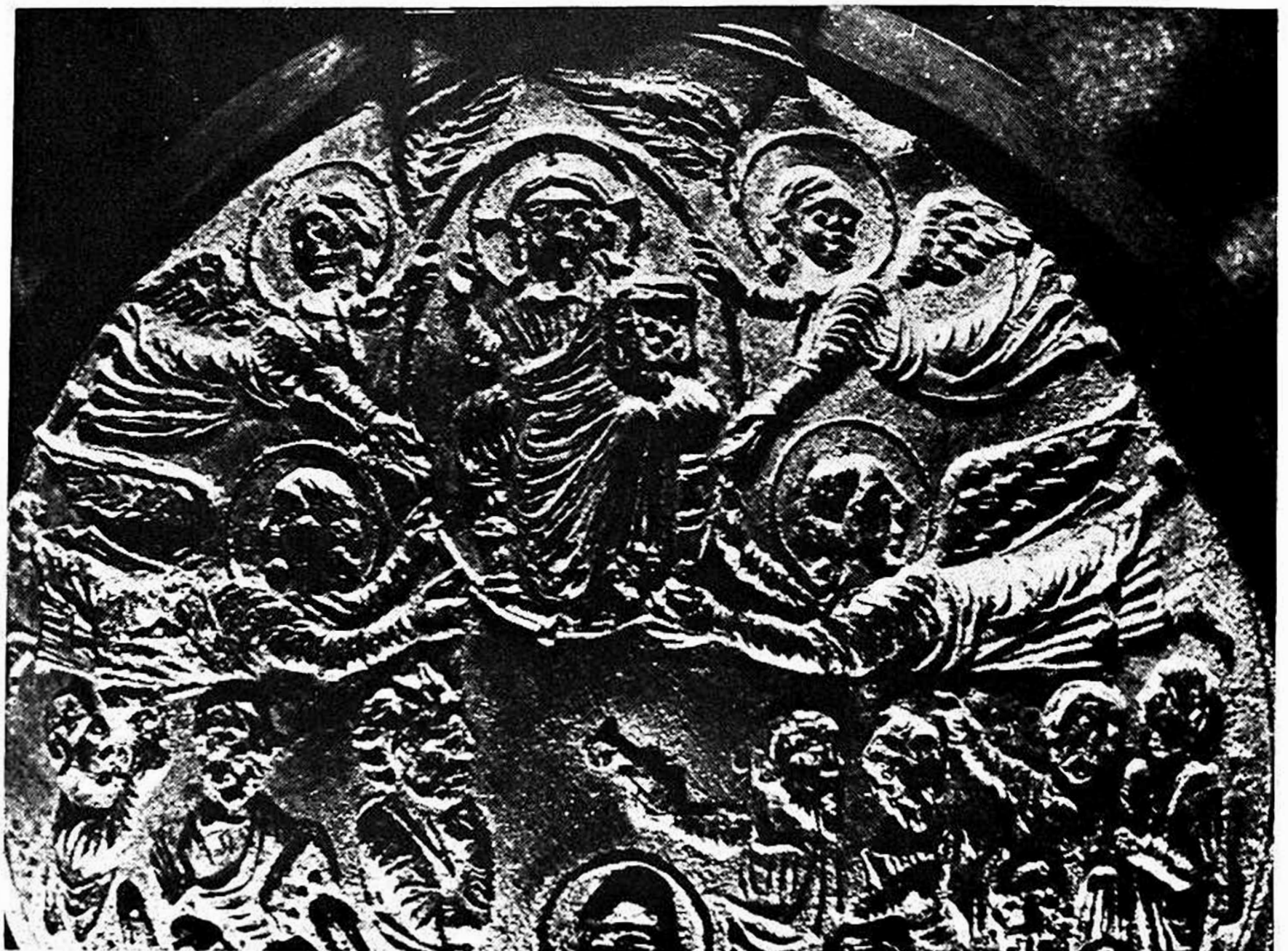
Fig. 5 - Monza. Tesoro del Duomo, ampolla palestinese (partic.) VI sec.