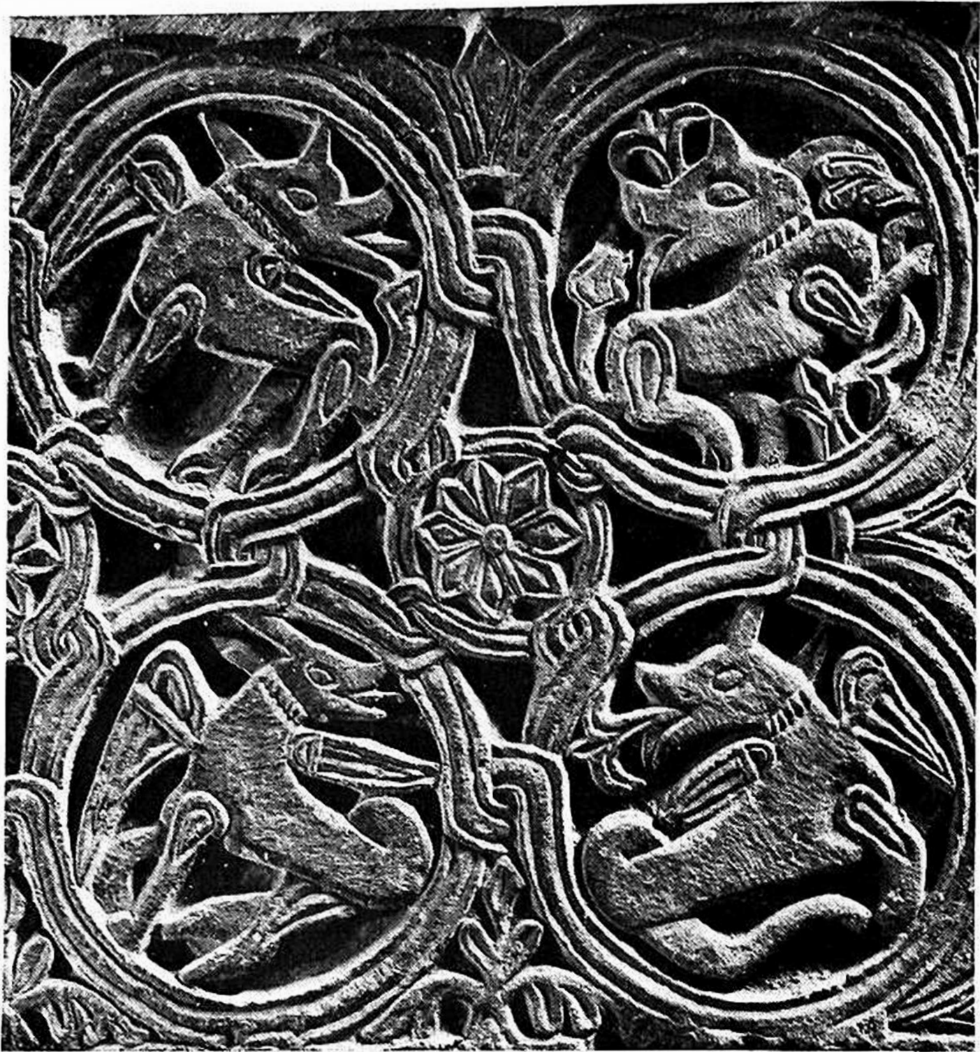
Fig. 4 - Monastero (Aquileia). Museo Cristiano, pluteo (partic.), prima metà IX sec.