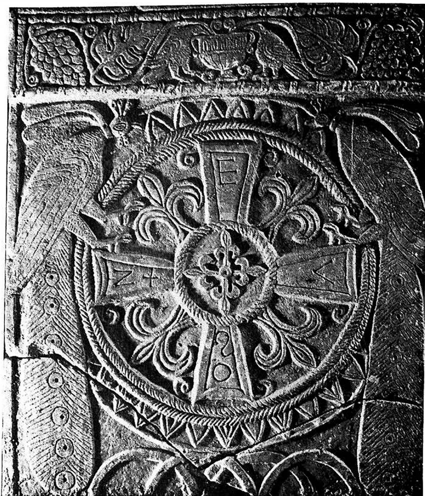
Fig. 2 - Monastero (Aquileia). Museo Cristiano, dossale di cattedra, c. metà VIII sec.