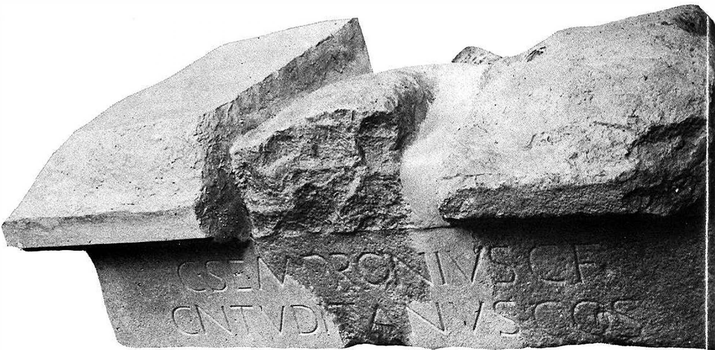
Fig. 4 - Epigrafe di C. Sempronio Tuditano (Castello di Duino. Ricostruzione Mirabella Roberti).