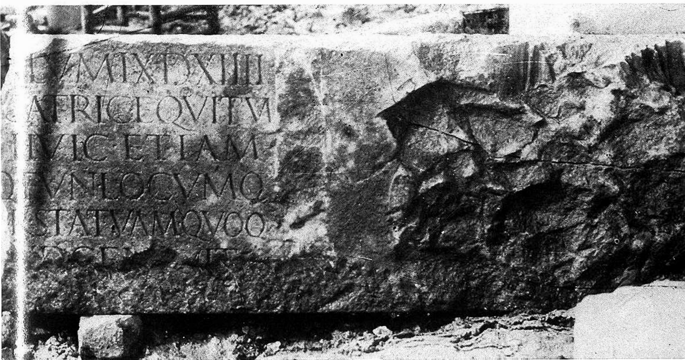
Fig. 7 - San Giovanni del Timavo - Epigrafe della educatrix equitum .