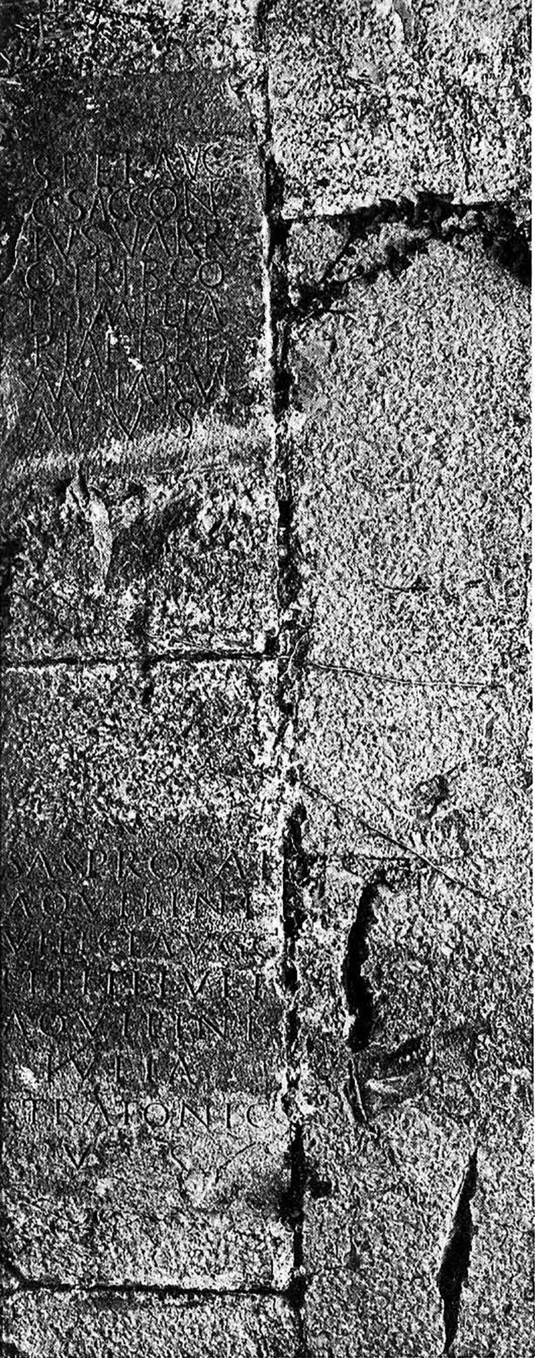
Fig. 1 - Epigrafi nell'abside della chiesa di San Giovanni del Timavo.