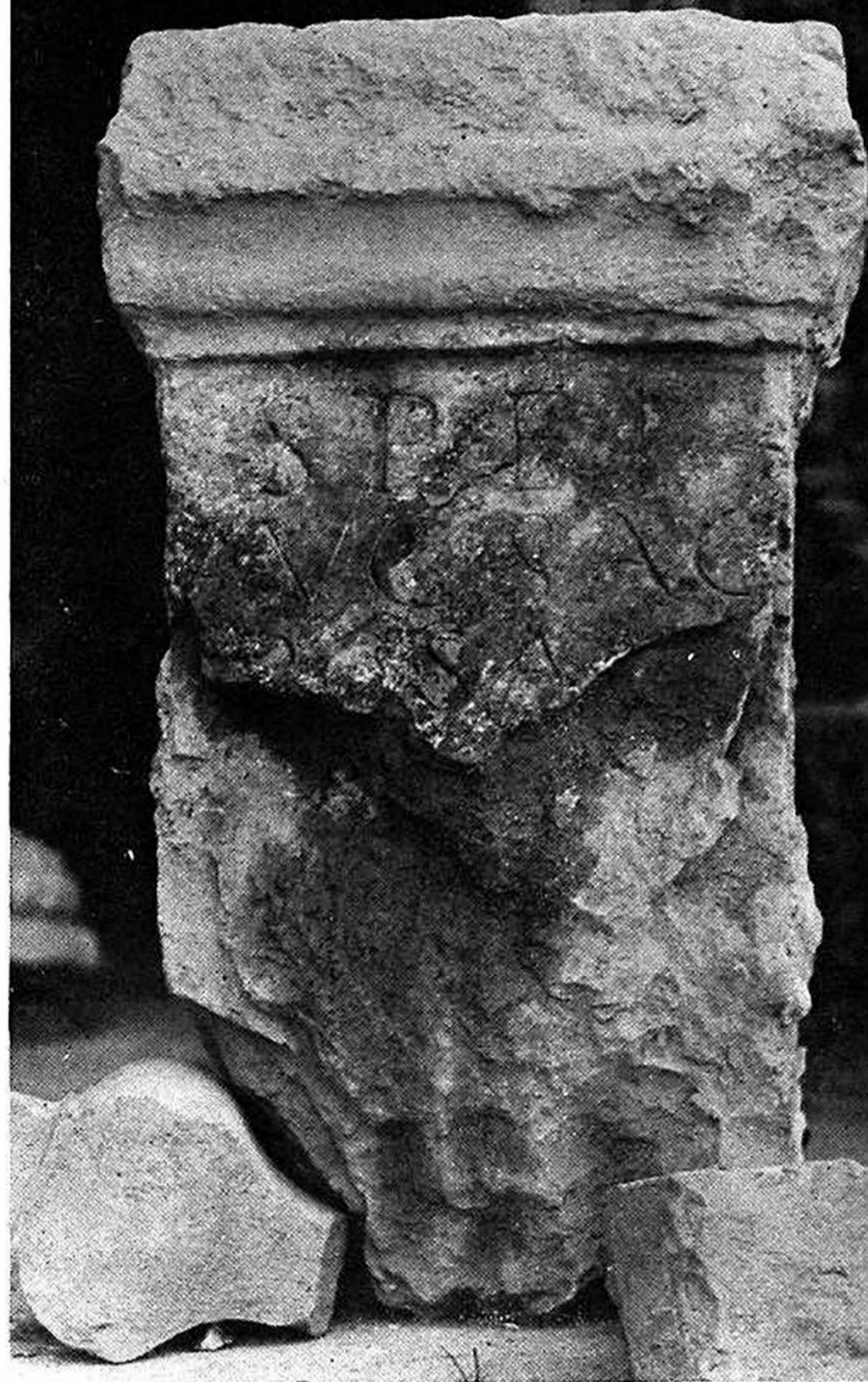
Fig. 2 - Aretta dedicata alla Spes Augusta .