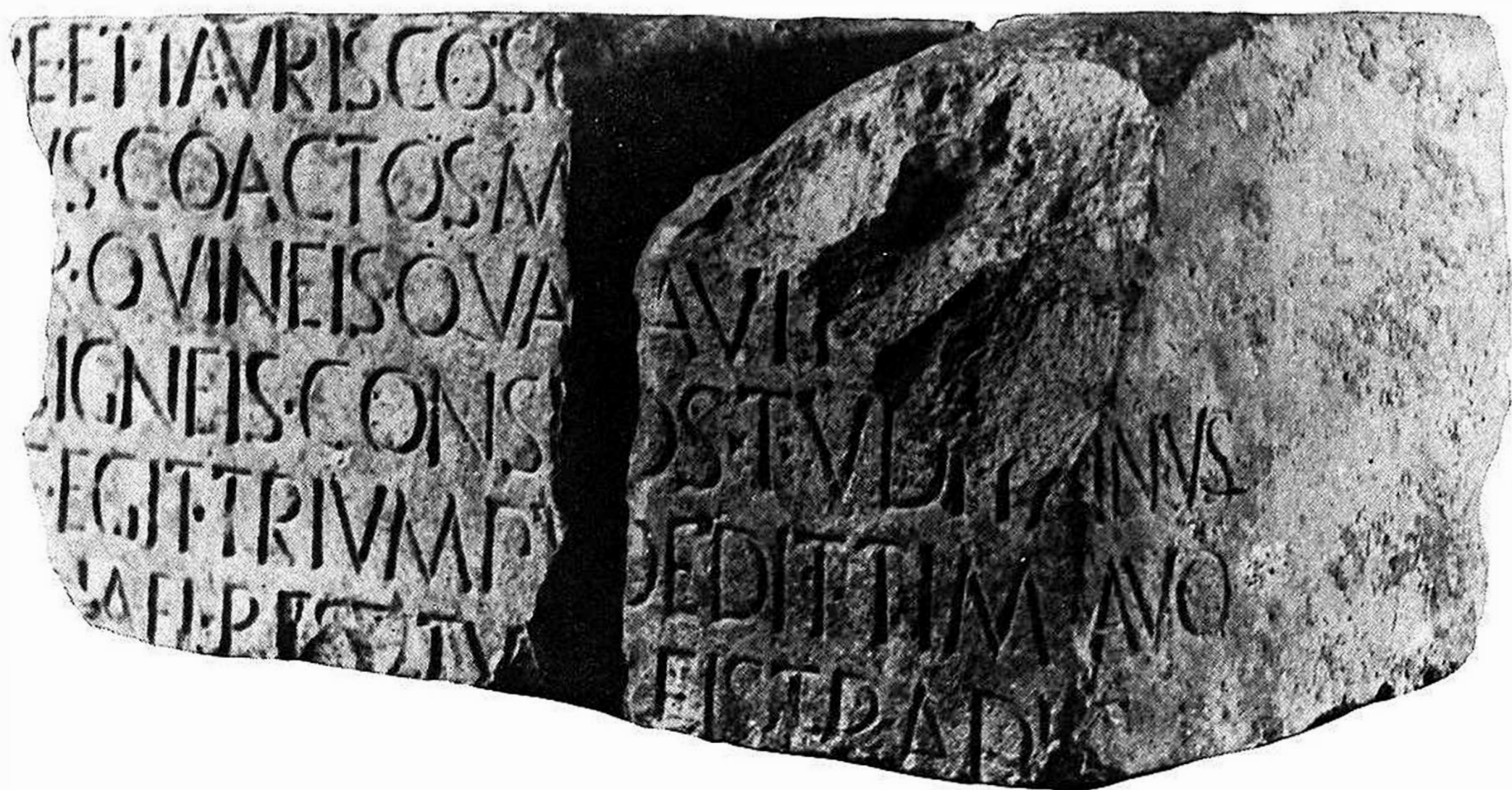
Fig. 6 - Elogium di C. Sempronio Tuditano (Museo Nazionale di Aquileia).