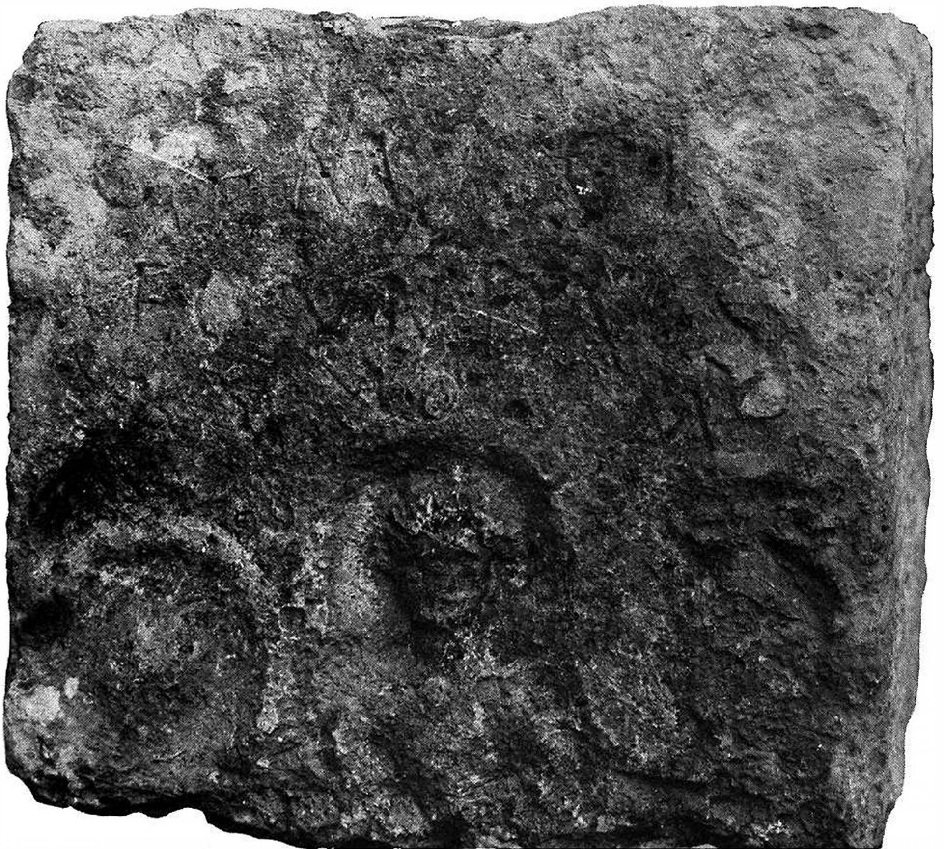
Fig. 5 - Epigrafe posta da C. Magius Secundus.