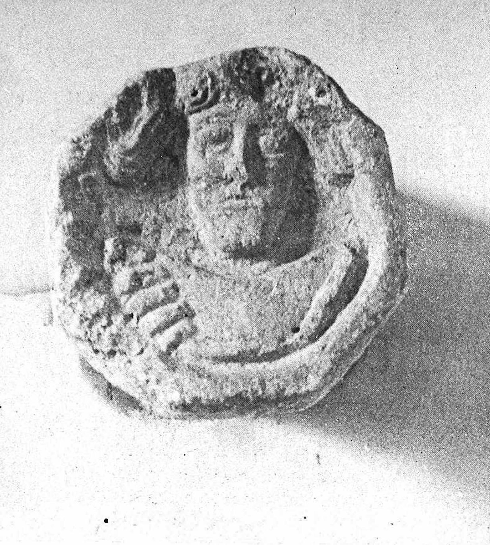
Fig. 6 - San Giovanni del Timavo. Chiave di volta con profeta.