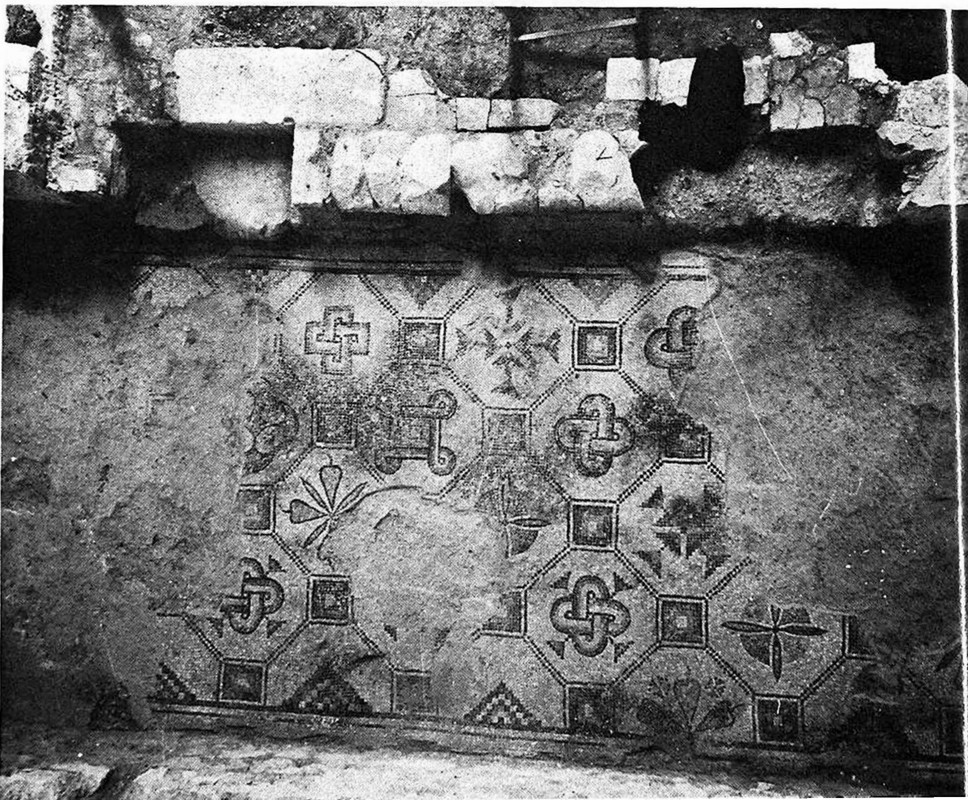
Fig. 4 - San Giovanni del Timavo. Il mosaico della prothesis.