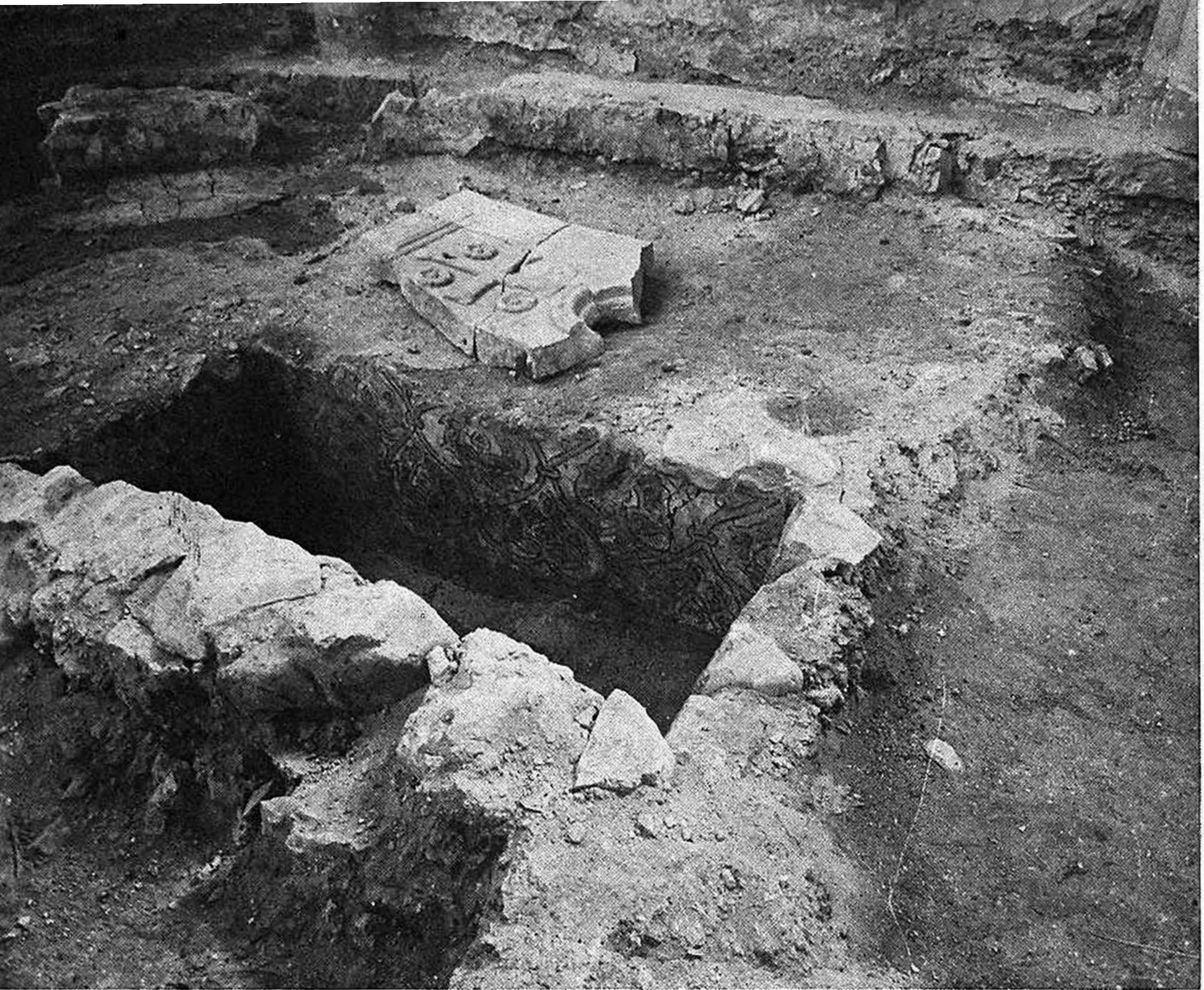
Fig. 3 - San Giovanni del Timavo. Il loculo nel presbiterio.