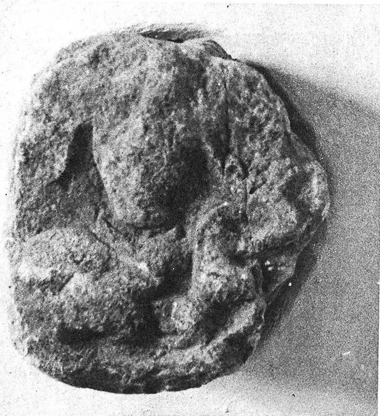
Fig. 7 - San Giovanni del Timavo. Chiave di volta.