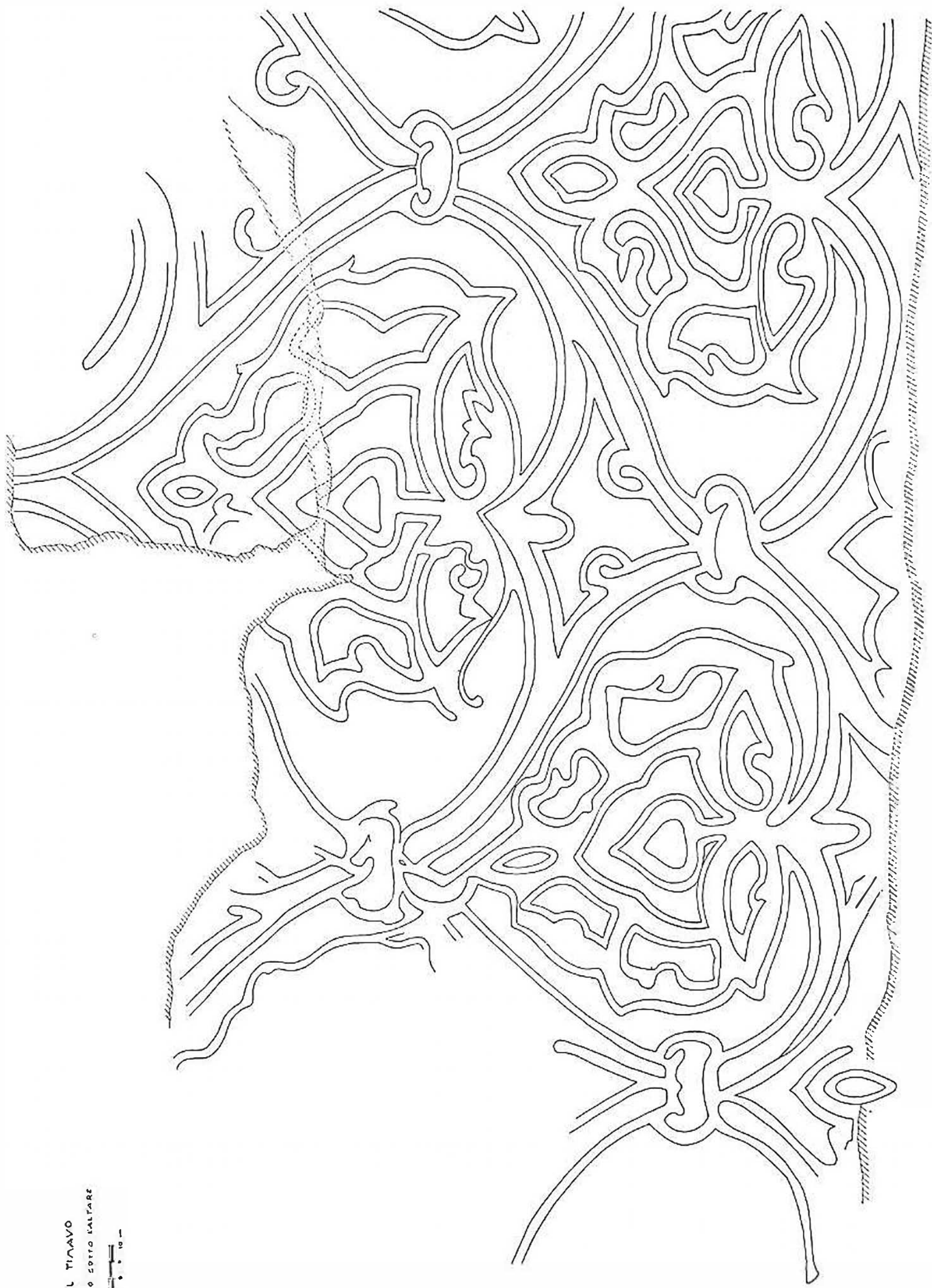
Fig. 5 - San Giovanni del Timavo. Decorazione del loculo nel presbiterio.