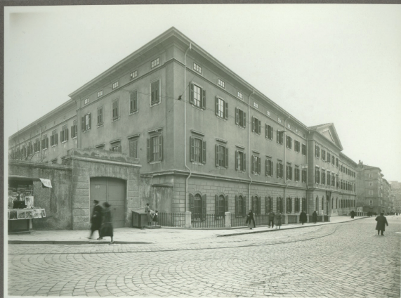
EDIFICIO DELLA PIA CASA DEI POVERI