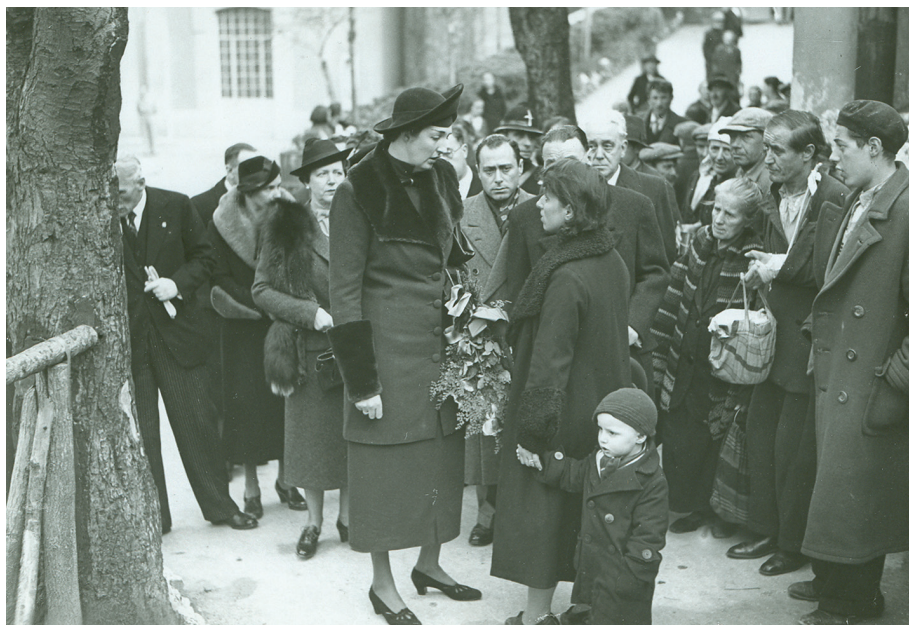
Fig. 2 – La Duchessa d'Aosta durante la sua visita all'Istituto dei poveri nel 1937.