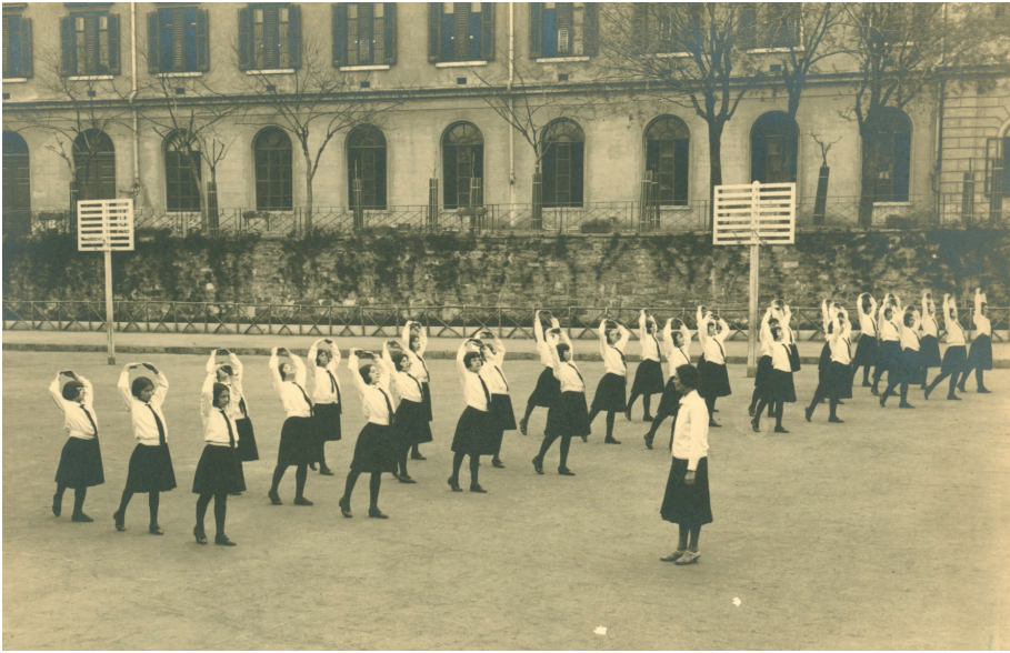
Fig. 5 – Le “piccole italiane” dell’educatorio femminile si esibiscono nel cortile dell’Istituto.