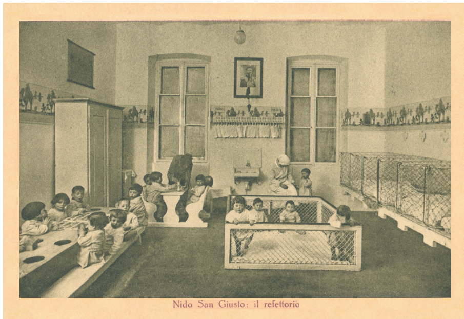
Fig. 3 – Il Nido San Giusto, funzionante dal 1923 al 1938 presso l'alloggio popolare di via Pondares.