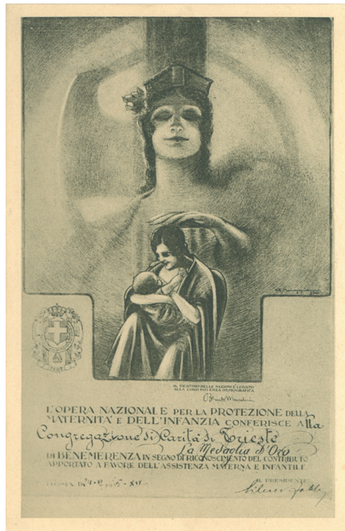
Fig. 6 – L’OMNI conferisce alla Congregazione di Carità di Trieste la medaglia d’oro, 1935. (AITIS, Trieste)