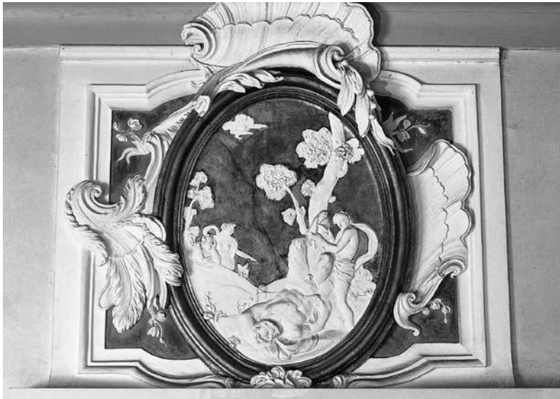
3 - ABBONDIO STAZIO e CARPOFORO MAZZETTI TENCALLA, Decorazione di sopraporta con Apollo che scuovia Marsia . Venezia, palazzo Driuzzi a Santa Croce