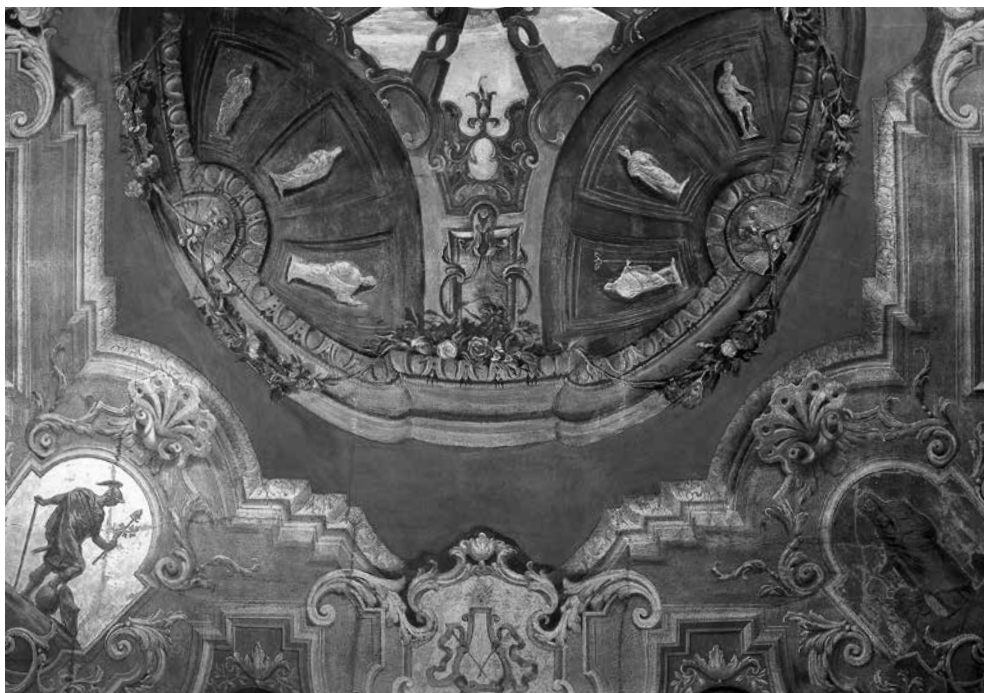
13 - GIROLAMO MENGOZZI COLONNA, Decorazione di soffitto , particolare. Venezia, palazzo Driuzzi a Santa Croce

go': motivo di rosone aperto sul cielo nella zona centrale, quattro lunette a fondo rosso tripartite con figurette femminili in monocromo all'antica, placchette angolari con personificazioni allegoriche in monocromo grigio su fondo dorato che si alternano a otto tondi con immagini analoghe su fondo rosso e a targhe dorate con simboli di divinità: il caduceo per Mercurio, i fulmini per Giove, la cetra per Apollo, spada e fiaccola per Marte (tav. x, figg. 12-13).