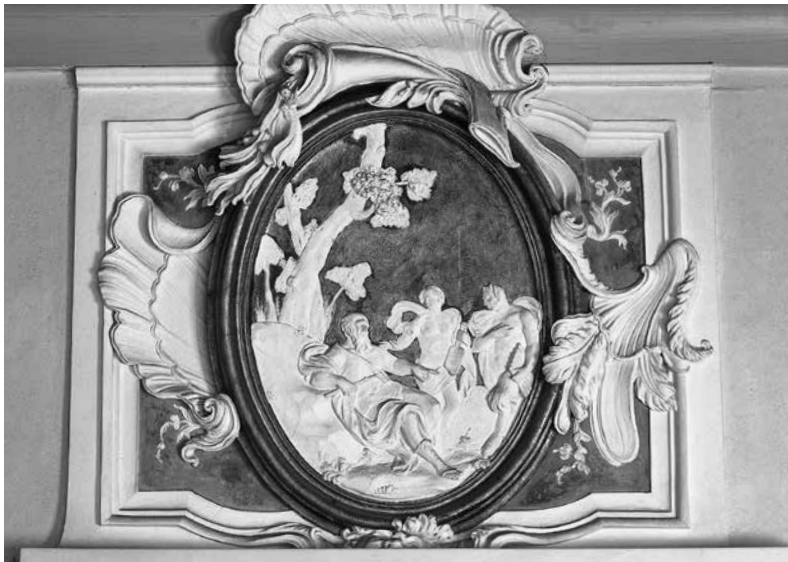
4 - ABBONDIO STAZIO e CARPOFORO MAZZETTI TENCALLA, Decorazione di sopraporta con la Gara di Apollo e Marsia . Venezia, palazzo Driuzzi a Santa Croce