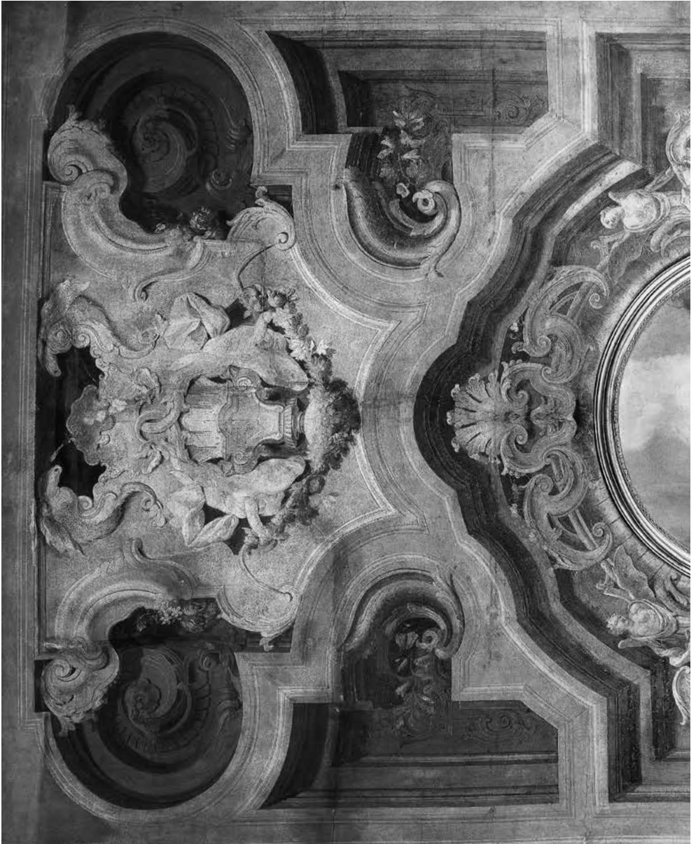
15 - GIROLAMO MENGOZZI COLONNA, Decorazione di soffitto , particolare. Venezia, palazzo Driuzzi a Santa Croce