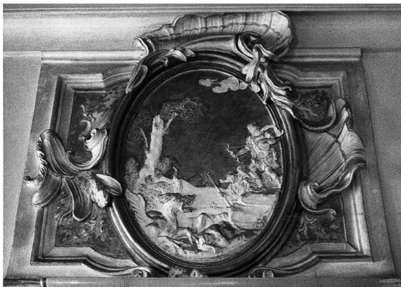
2 - ABBONDIO STAZIO e CARPOFORO MAZZETTI TENCALLA, Decorazione di sopraporta con Giasone che sconfigge il drago . Venezia, palazzo Driuzzi a Santa Croce