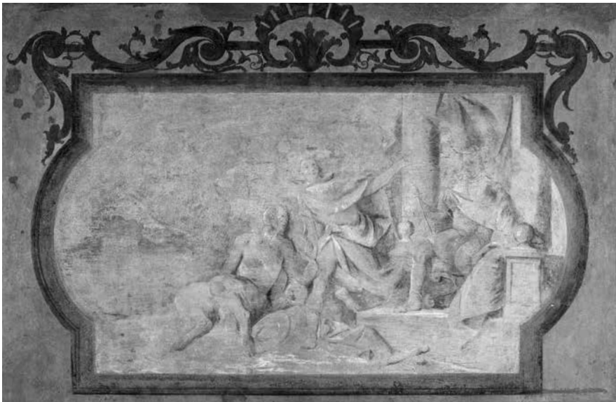
6 - GIAMBATTISTA e GIANDOMENICO TIEPOLO, Apollo, Pan e Mida . Venezia, palazzo Driuzzi a Santa Croce