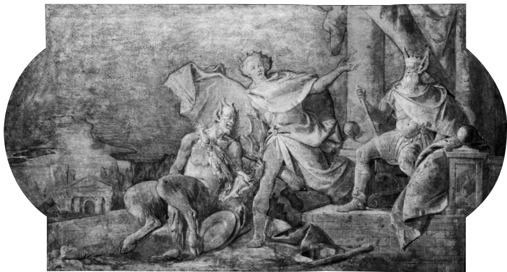
10 - GIAMBATTISTA E GIANDOMENICO TIEPOLO, Apollo, Pan e Mida . Già Venezia, palazzo Driuzzi a Santa Croce