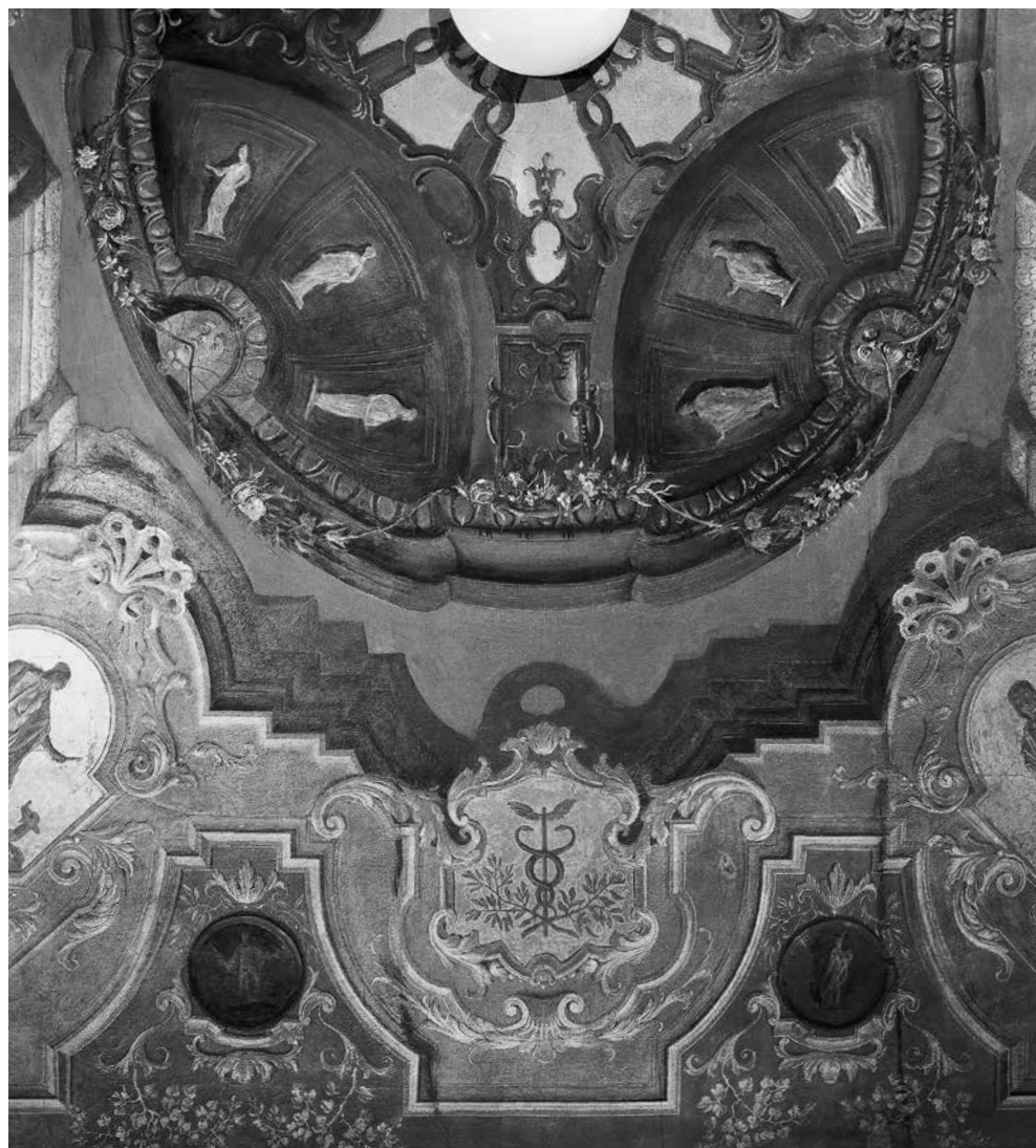
12 - GIROLAMO MENGOZZI COLONNA, Decorazione di soffitto , particolare. Venezia, palazzo Driuzzi a Santa Croce