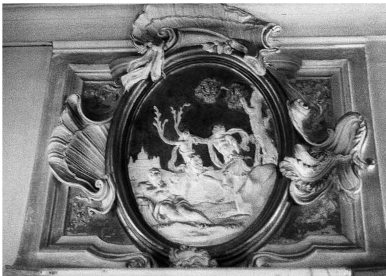
1 - ABBONDIO STAZIO e CARPOFORO MAZZETTI TENCALLA, Decorazione di sopraporta con Apollo e Dafne . Venezia, palazzo Driuzzi a Santa Croce