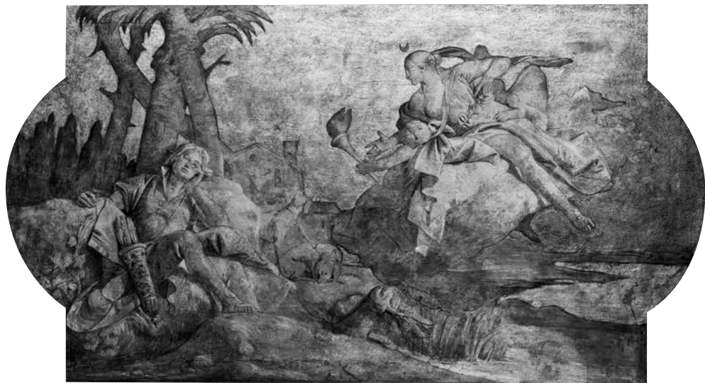
9 - GIAMBATTISTA E GIANDOMENICO TIEPOLO, Diana ed Endimione . Già Venezia, palazzo Driuzzi a Santa Croce