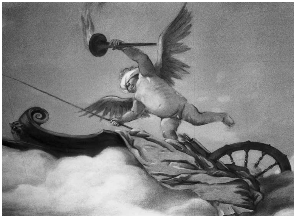
14 - Copia da GIAMBATTISTA TIEPOLO, Cupido bendato con fiaccola sul carro , particolare. Venezia, palazzo Driuzzi a Santa Croce

nella monografia pubblicata da Ongania nel 1881 ( Tiepolo. La Villa Valmarana ) 9 .