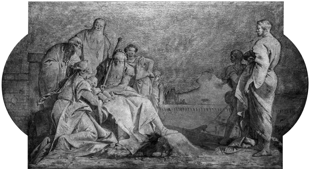
11 - GIAMBATTISTA e GIANDOMENICO TIEPOLO, Achille e Tiresia . Già Venezia, palazzo Driuzzi a Santa Croce

I tre dipinti ex Dirksen sono poi transitati presso Agnew a Londra verso il 1934, ma i titoli cambiano, poiché vi compare la cosiddetta Infanzia di Bacco , e non Apollo e Dafne 5 .