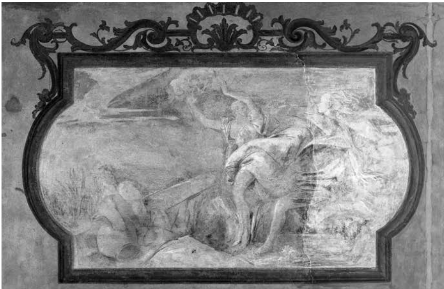
8 - GIAMBATTISTA e GIANDOMENICO TIEPOLO, Apollo e Dafne . Venezia, palazzo Driuzzi a Santa Croce