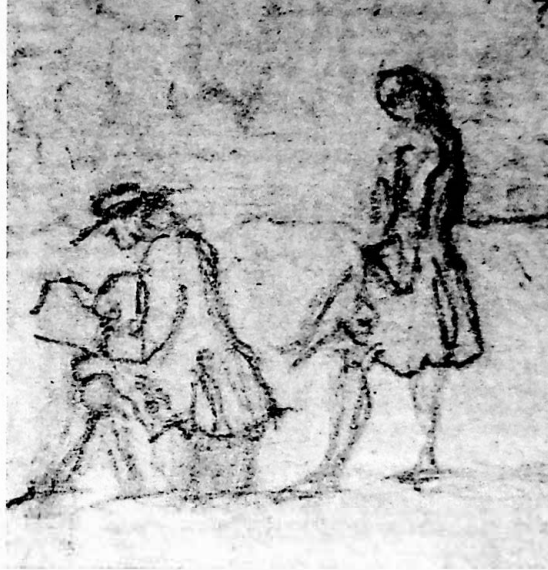
Fig. 7 – Il Bertoli, assistito dal suo cameriere, sta disegnando i resti dell'acquedotto romano di Aquileia (da VALE p. 29).