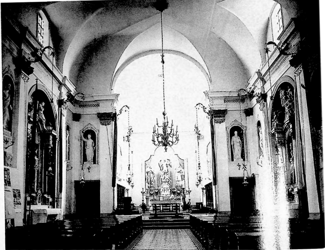
Fig. 4 - La chiesa parrocchiale di Mereto di Tomba.