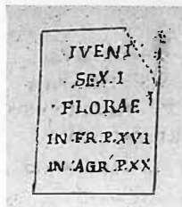
Fig. 8 – Scrittura in un vaso di vetro (G.D. Bertoli, Antichità di Aquileia , Venezia 1739, n. 31).