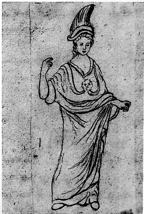
Fig. 11 – Statuetta di Minerva (G.D. BERTOLI, Antichità di Aquileia , ms. tomo 1, presso la Biblioteca del Seminario arcivescovile di Udine, n. 671).