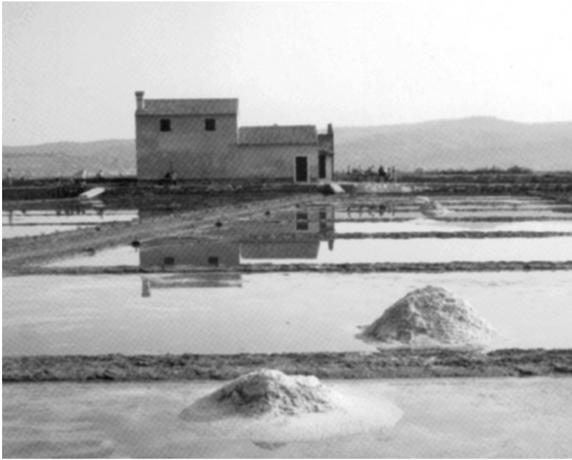
FIGURA 3 Il salaro restaurato