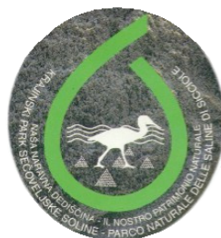
FIGURA 6 Logo del Parco naturale delle saline di Sicciole

Questo inestimabile patrimonio è accessibile via terra superando l'ex confine di Stato sloveno e, una volta giunti in corrispondenza di Sicciole, svoltando a destra per procedere lungo il viottolo che, attraverso i fondi abbandonati, porta al "Museo delle saline". La realtà museale è aperta da aprile a novembre, dalle ore 9 alle 12 e dalle 15 alle 18, mentre nei mesi estivi di luglio e agosto amplia l'apertura pomeridiana dalle 16 alle 19. Durante gli altri periodi dell'anno