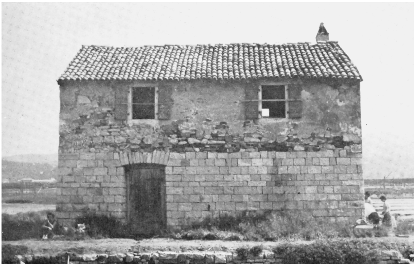
FIGURA 4 La tipica casa dei salinari