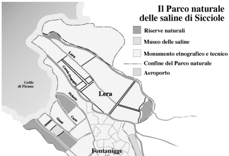
FIGURA 2 Pianta del Parco delle saline di Sicciolo con relativo Museo