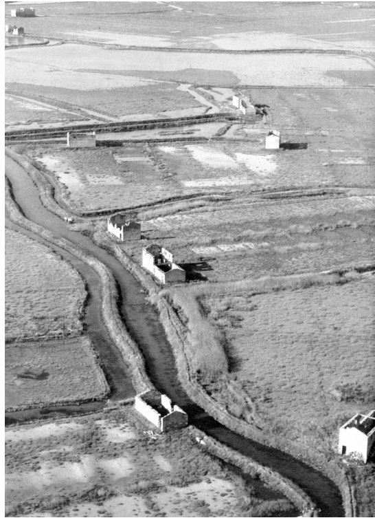
FIGURA 1 Saline e salari abbandonati