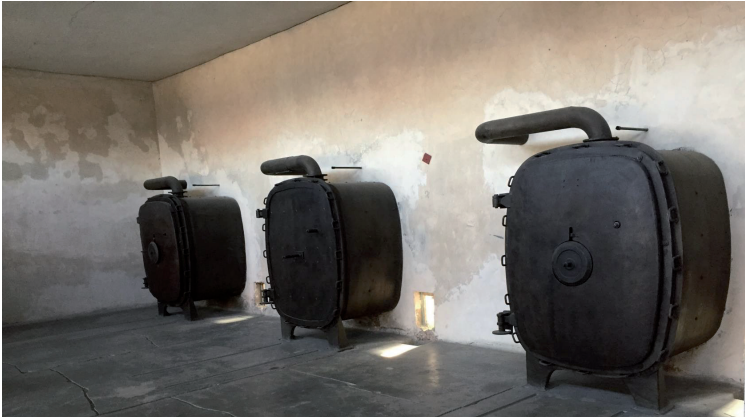
Birkenau: stufe per la sterilizzazione dei vestiti recuperati dopo le uccisioni.