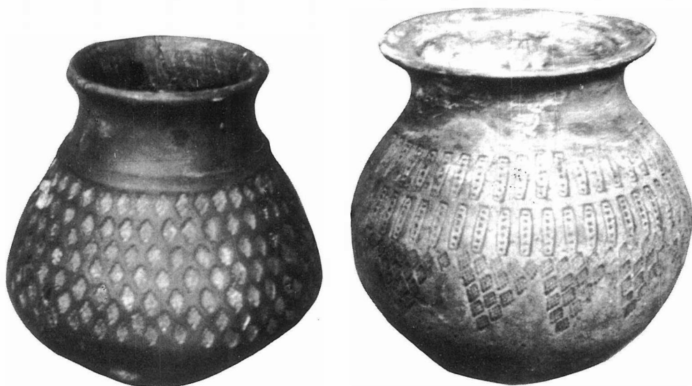
Fig. 3/4 - Cividale del Friuli (Udine); ceramica longobarda «a stampiglia» (foto Museo Arch. Naz. di Cividale).