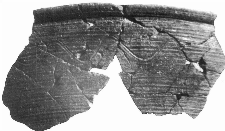
Fig. 1 - Romans d'Isonzo (Gorizia); ceramica autoctona: frammento di catino? (foto G. Almerigogna, Soprintendenza per i Beni AAAA e S. del Friuli - Venezia Giulia).