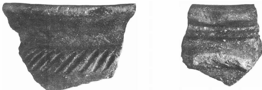
Fig. 2 - Mossa (Gorizia); ceramica attribuibile al periodo delle migrazioni dei popoli.