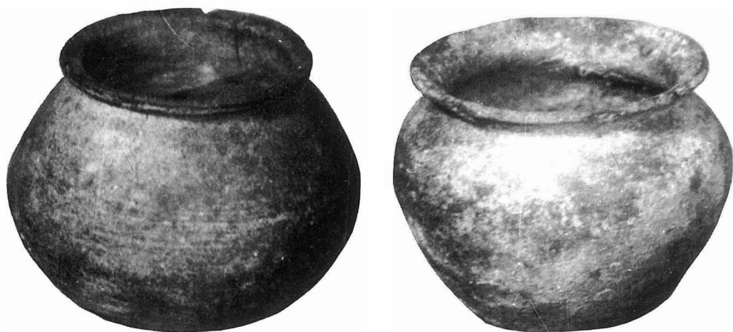
Fig. 5/6 - Cividale del Friuli (Udine): ceramica autoctona.