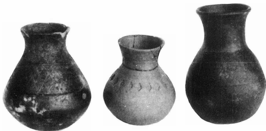
Fig. 7 - Ortaia (Verona); ceramica longobarda (da L. Salzani).