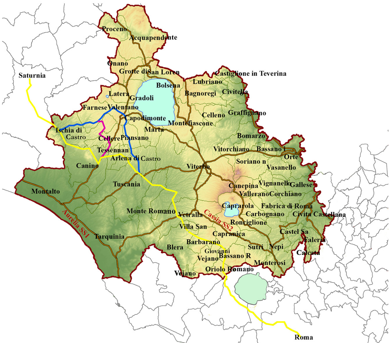
FIGURA 1 – In giallo, viola e blu le tre ipotesi di collegamento e raccordo delle città attraversate dal tracciato originario della Via Clodia