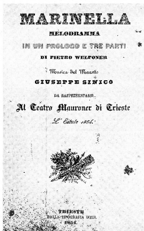
Teatro Mauroner 1854 - 2.a edizione