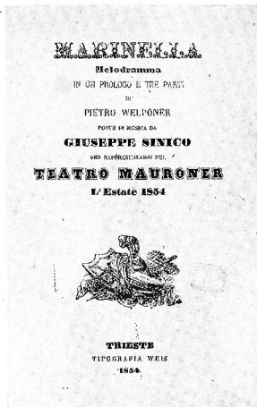
Teatro Mauroner 1854 - 1.a edizione