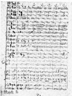
„Viva San Giusto“ dallo spartito autografo