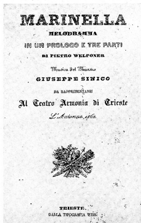
Teatro Armonia 1862