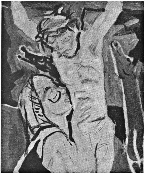
Crocifissione - a. 1946