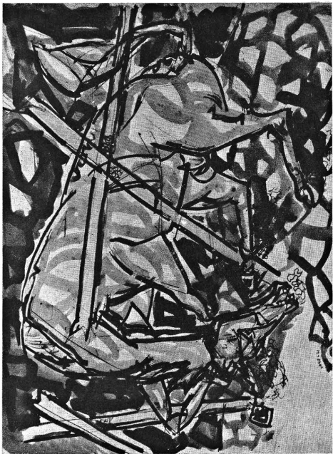
Cavallo - a. 1947