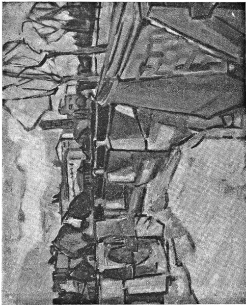
Ponte rotto - a. 1947