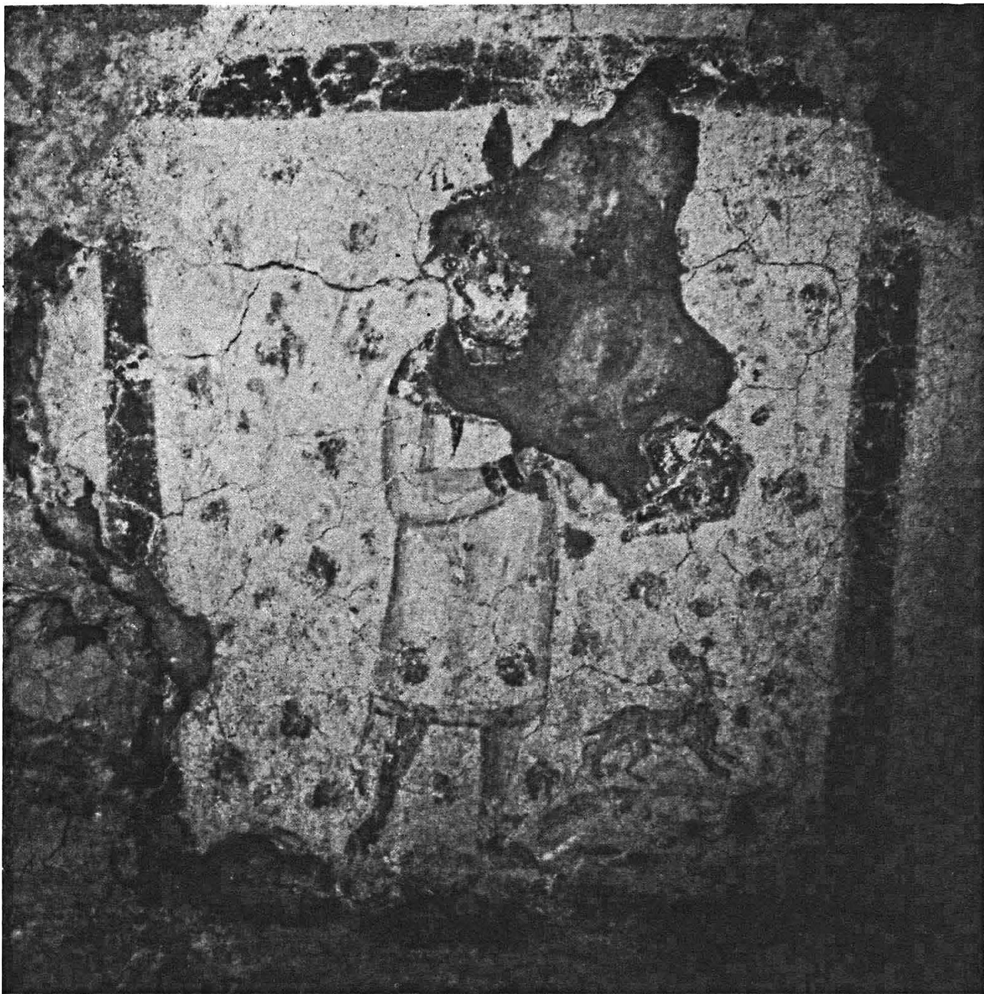
FIG. 1 - Siracusa, catacomba di S. Maria: affresco della Galleria N-9.

vergere l'attenzione dell'osservatore sull'oggetto che è nell'opposta mano. Ma l'impiego del cemento ha anche qui nociuto alla perspicuità di uno dei particolari più importanti, che avrebbe potuto condurre alla identificazione della figura.