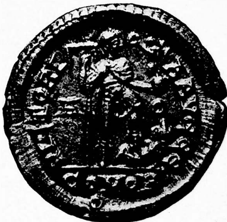
Tipi monetali della Zecca di Aquileia.