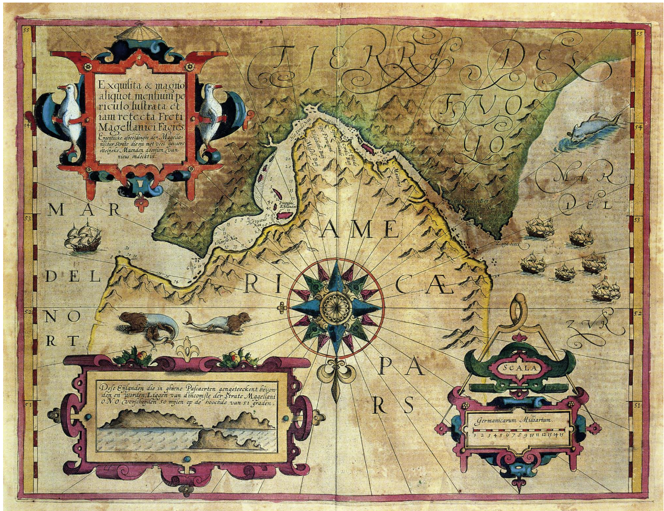
FIGURA 3. Mappa di Mercatore rappresentante lo Stretto di Magellano e risalente al 1594.

È suggestivo notare che la mappa assomiglia maggiormente ad un portolano che ad una carta isogona, in barba alla data della sua pubblicazione.